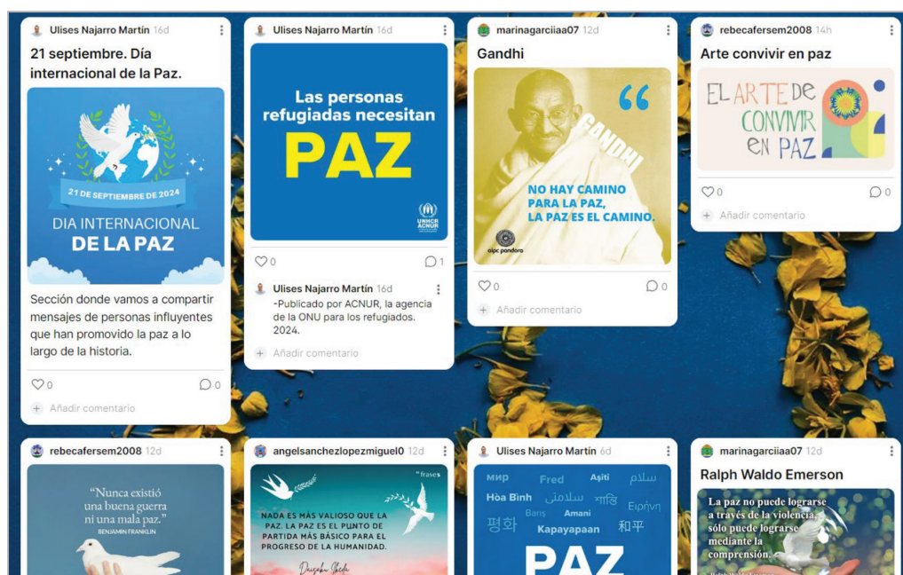
Figura 3. Ejemplo de contribuciones en la sección “Mensajes por la Paz”