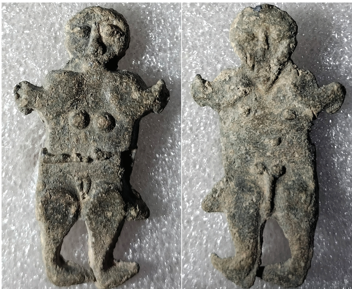
Figura 3. Cara femenina y masculina, detalle.

En cuanto a los detalles de cada cara, en la figura femenina se marcaron muy intencionadamente los pechos y la vulva, así como el ombligo, que también está marcado en la otra cara, la de la figura masculina. Los detalles del rostro se marcan esquemáticamente, incluso groseramente. El cabello es casi inexistente. Sí se advierten unos labios carnosos en una boca estrecha, así como unos cortos dedos de las manos. Lo más distintivo es un cinturón a la altura del ombligo, al que cubre en parte. Los pies de esta cara femenina apuntan a la derecha del observador, diferencia sustancial con la mayoría de paralelos que suelen tener las piernas abiertas y separadas, lo que ha servido para adscribirlos como exvotos relacionados con la fertilidad.