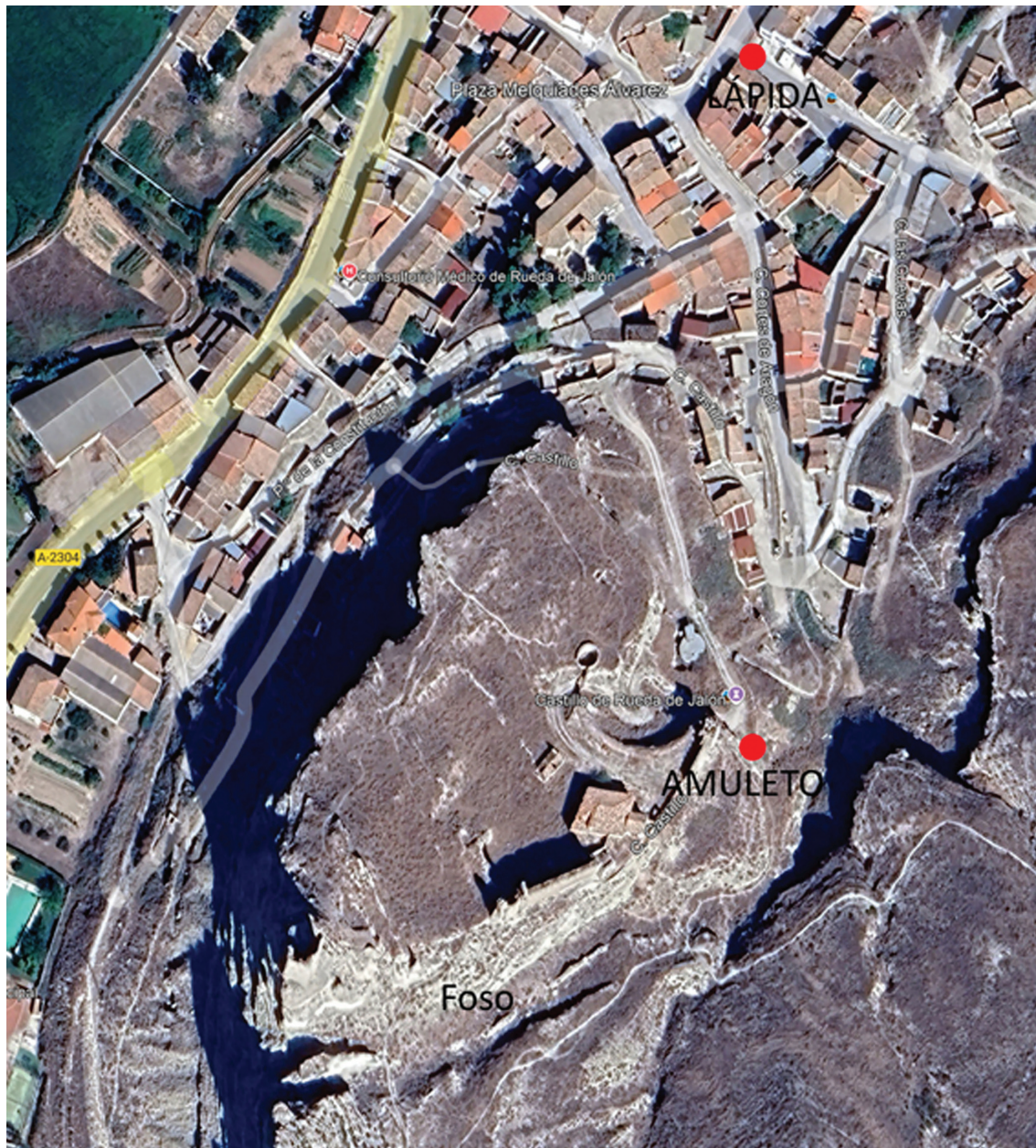
Figura 2. Localización de los hallazgos.

mejorando su conocimiento, conservación y posibilidad de disfrute de visita pública.