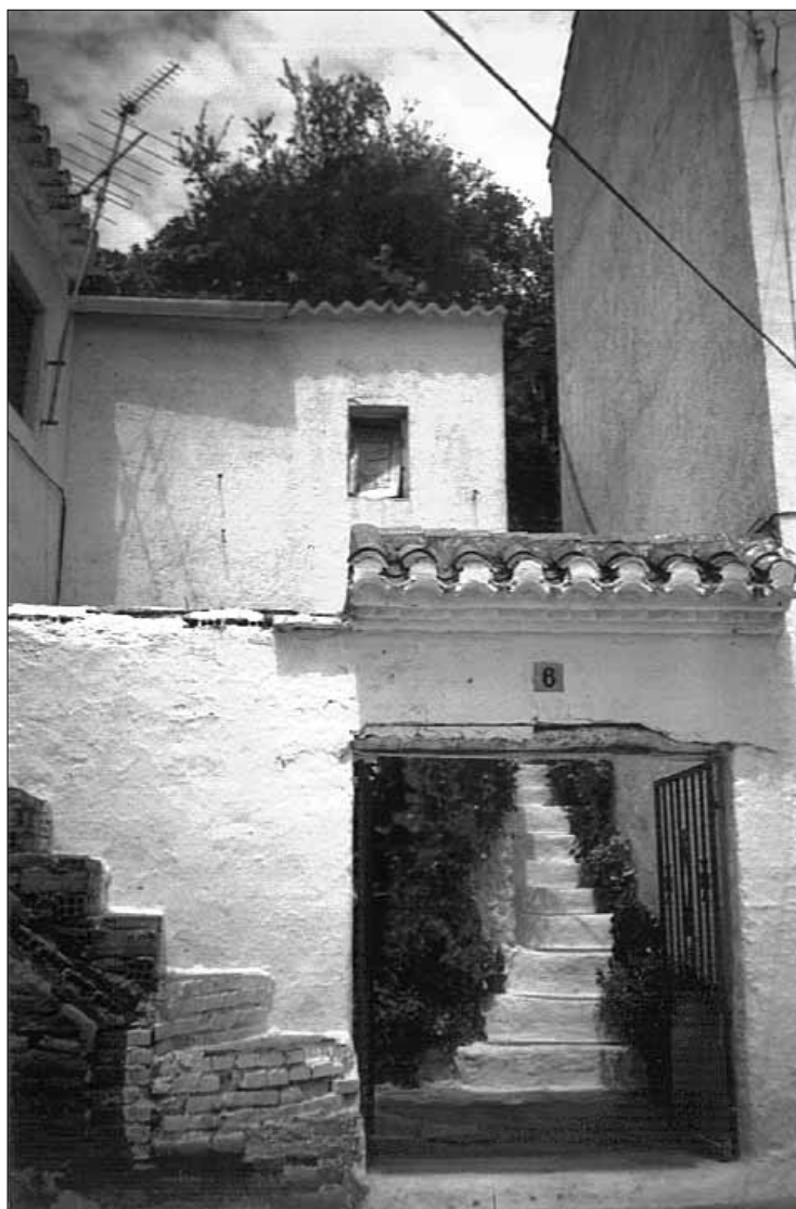
Lám. 2. Calle de Saleres.