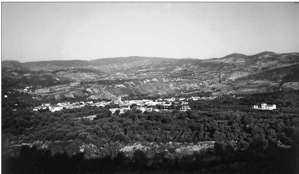
Lám. 1. El municipio de El Valle desde la carretera que se dirige a la costa granadina.