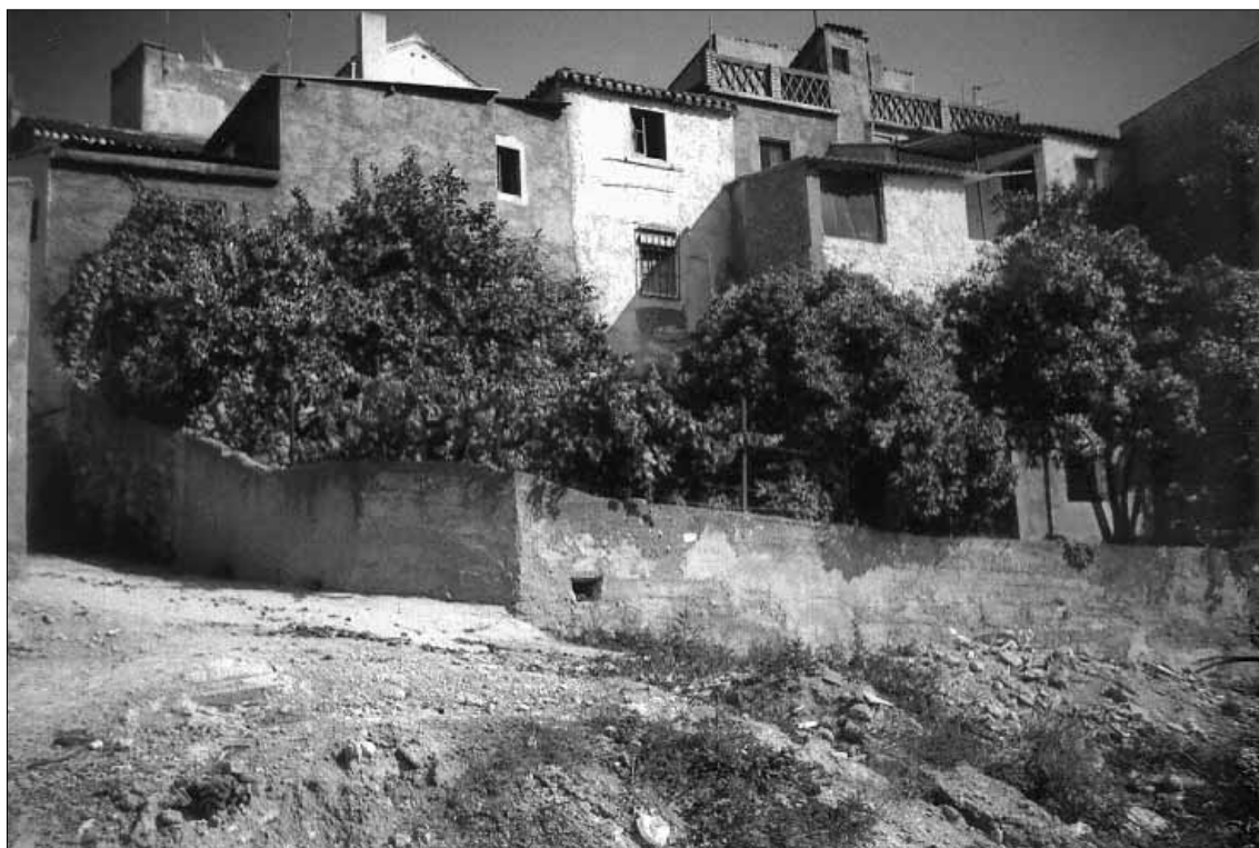
Lám. 4. Saleres, grupo de huertos catalogado como conjunto ambiental.