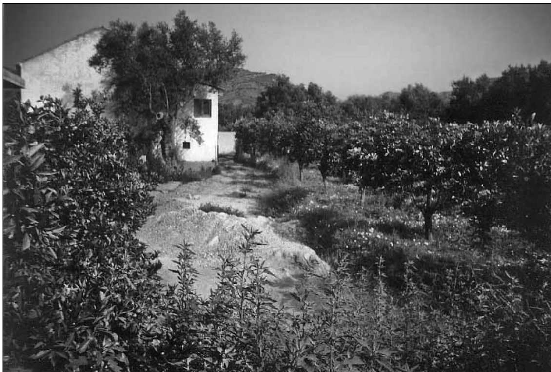
Lám. 5. Melegís, conjunto ambiental periférico.