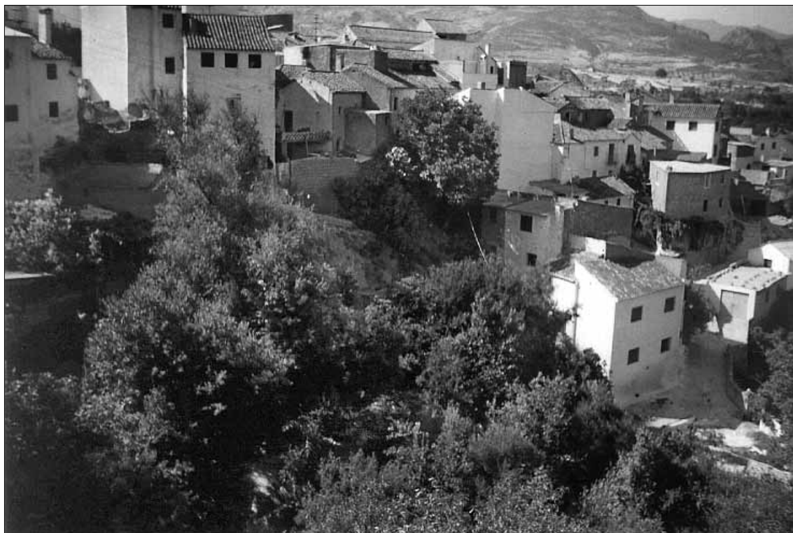
Lám. 3. Saleres, huertos intercalados con las viviendas.