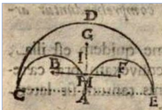
IMAGEN 3. Pauli Guldini, De centro gravitatis, 1635, pág. 88