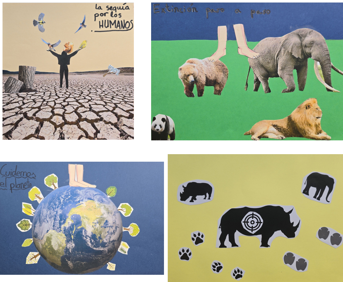
Figura 2. Collages creados por algunos discentes participantes en la experiencia.

No obstante, no todos los discentes realizaron un collage propiamente dicho, sino que algunos acabaron por elaborar una ilustración a dibujo. Por añadidura, la mayoría de las obras no tomaron como referencia la obra de la artista Carlota Gómez Touet, pese a haberse analizado e interpretado algunas de sus ilustraciones en la segunda sesión.