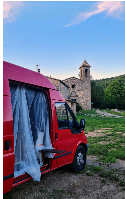
Figura 15. Esquemas, mediciones, foto instantánea y acuarela (a. 5) y figura 16. Noche ante la ermita Santa Maria dels Torrents, L'Espunyola (a. 5)