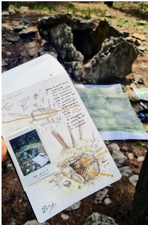
Figura 17. Esquemas, mediciones, foto instantánea y acuarela del Dolmen de Sant Almanç, Calders (a. 8)