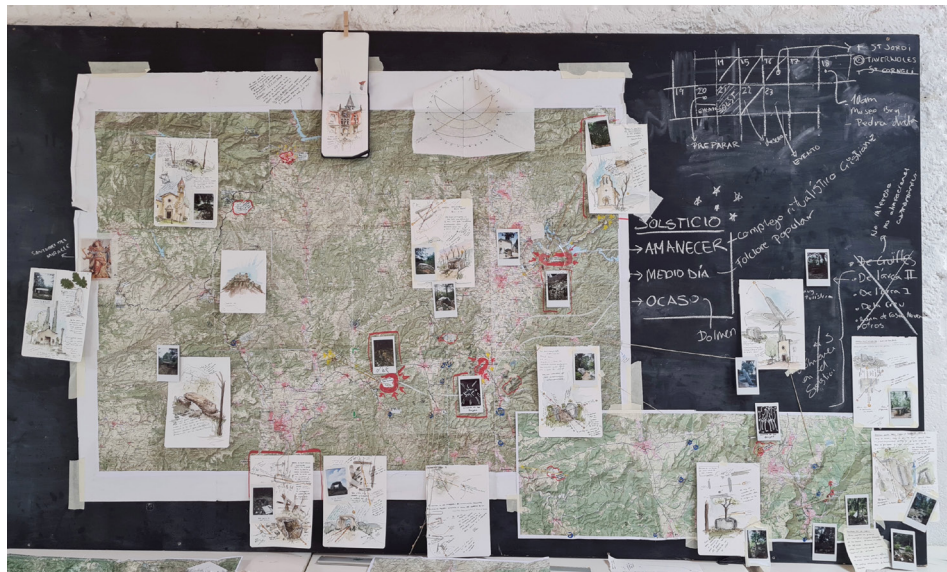
Figura 20. Plano de campo con anotaciones, diagramas, acuarelas, fotos y otros objetos recogidos. (Acción 17)