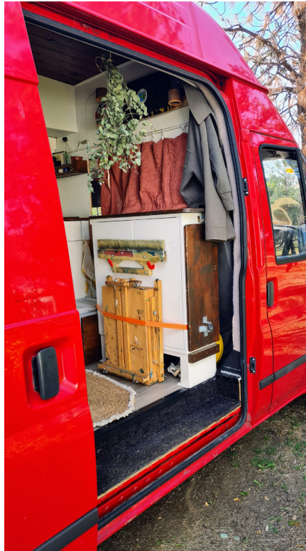
Figura 14. Material de pintura en hábitat camper del/de la autor/a 3