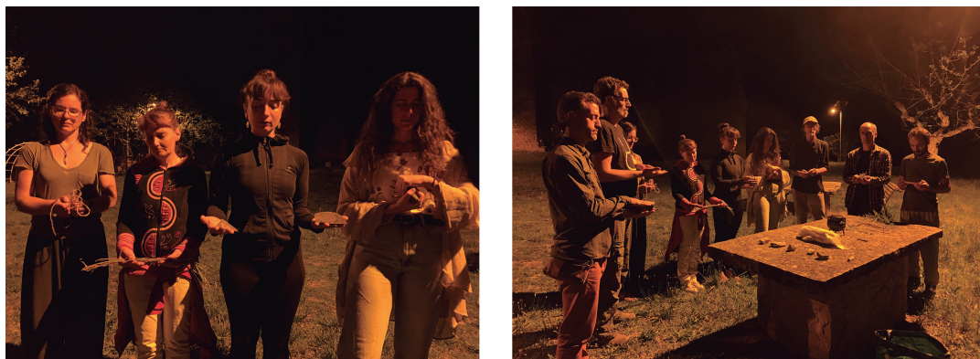
Figura 11. Ejercicio de psicometría de la actividad Escuchar fuego (a. 10)