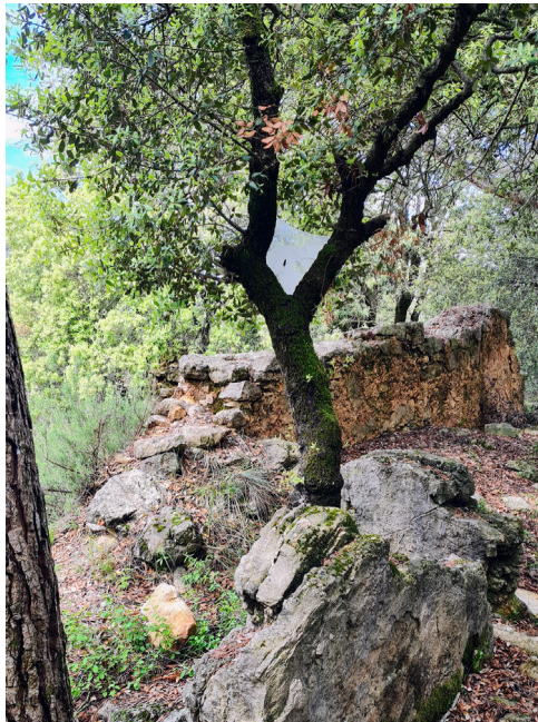
Figura 19. Ruta dolménica de 8km, Aiguafreda. (Acción 14)