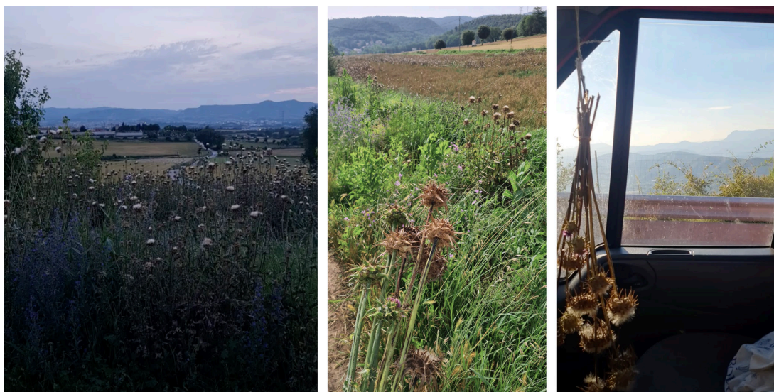
Figura 24. Cardos silvestres recolectados en el solsticio de verano (Acción 30).