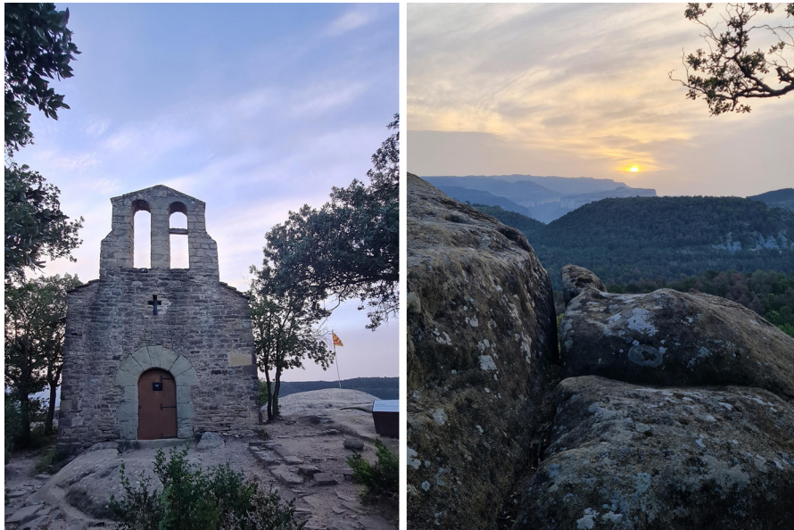
Figura 21. Alineación solar al amanecer del solsticio de verano en Sant Feliu (Acción 19, 26 y 29)