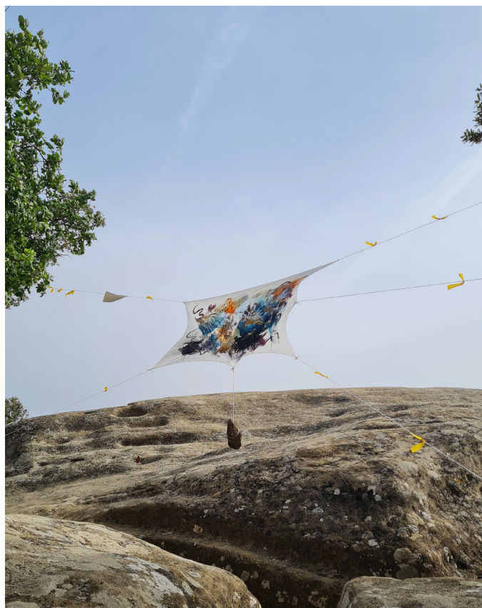
Figura 23. La "ausente" del amanecer tras ser pintada en el solsticio de verano 2023, Sant Feliu (Acción 19, 26 y 29).