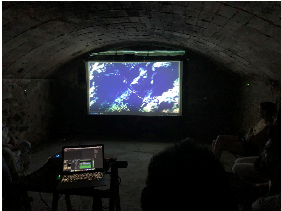
Figura 12. Bodega intervenida para la presentación de la propuesta audiovisual (a.14)