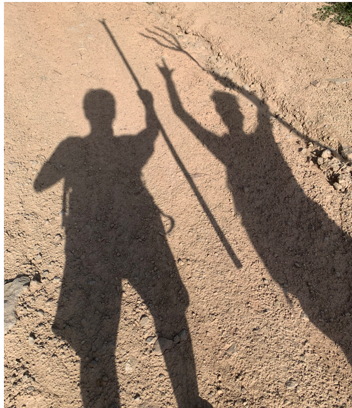
Figura 13. Artistas durante el proceso de reconocimiento del territorio