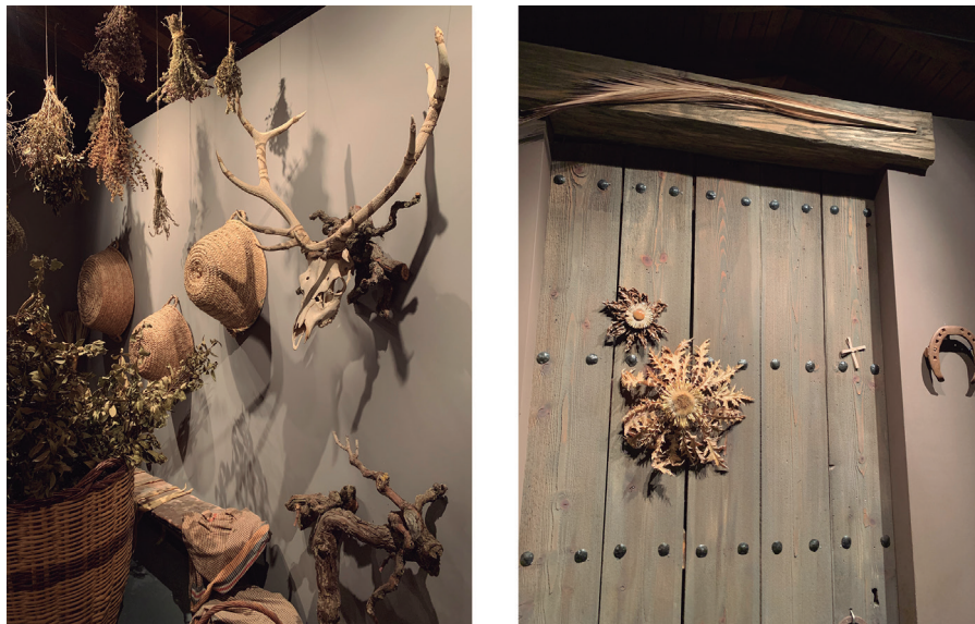
Figura 2. Centre d'Interpretació de la Bruixeria (Sant Feliu Sasserra) (a. 3)