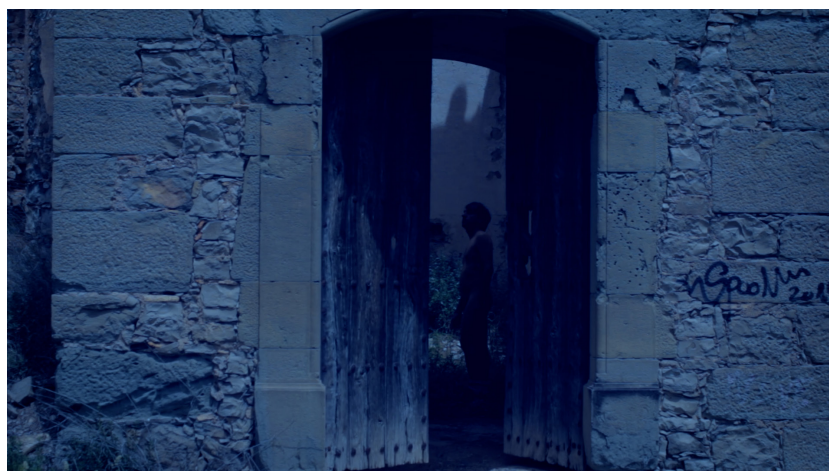
Figura 7. Acción con inducción de trance a través del uso de ungüentos enteógenos en las inmediaciones de Abadal de Dalt (a. 4)