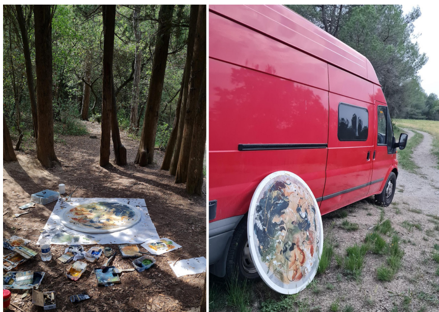
Figura 25. La” Profecía”, pintada a mediodía en Cercle de les Bruixes, Centelles. (Acción 31 y 33).