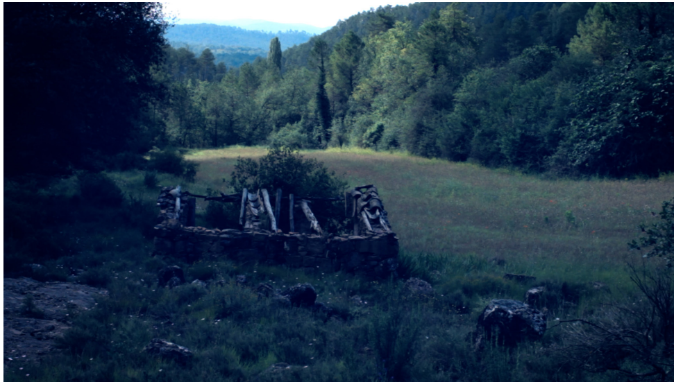
Figura 1. Construcción abandonada, descubriendo nuevas historias durante el estudio del territorio (a. 7)