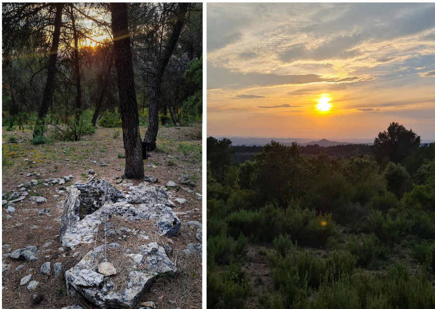
Figura 22. Alineación solar al ocaso del solsticio de verano desde Sant Almanç. (Acción 20, 23 y 32).