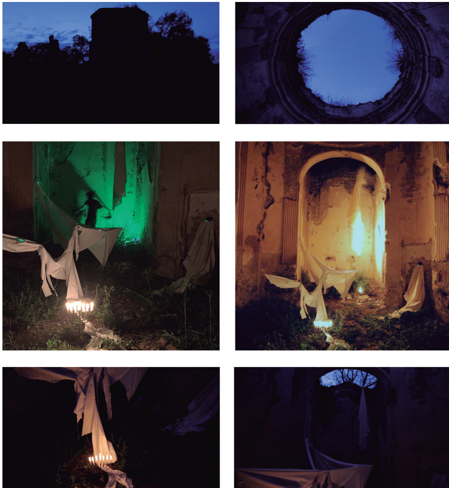
Figura 10. Instalación lumínica y acción performática en el interior de Abadal de Dalt (a. 8)