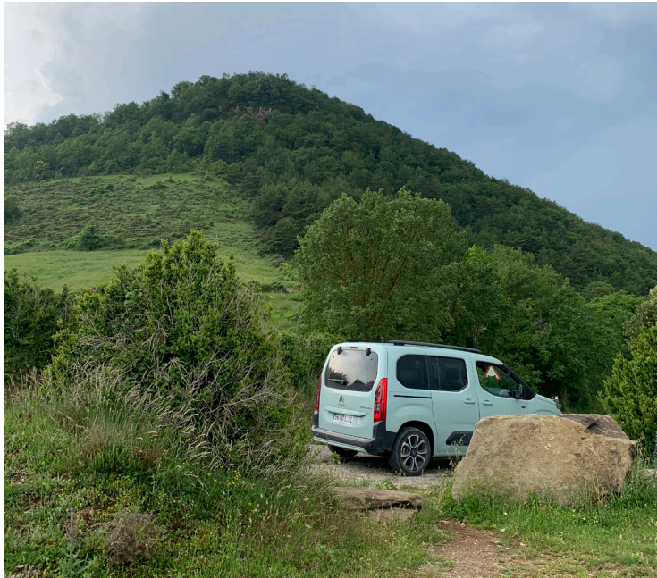
Figura 3. Hábitat camper durante el proyecto Geografía Astral