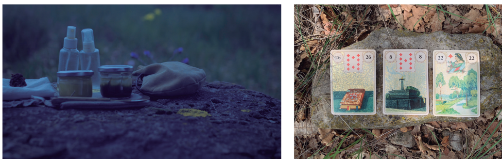
Figuras 5 y 6. Instrumentos para desarrollar la visión y el contacto con el entorno (a. 4)