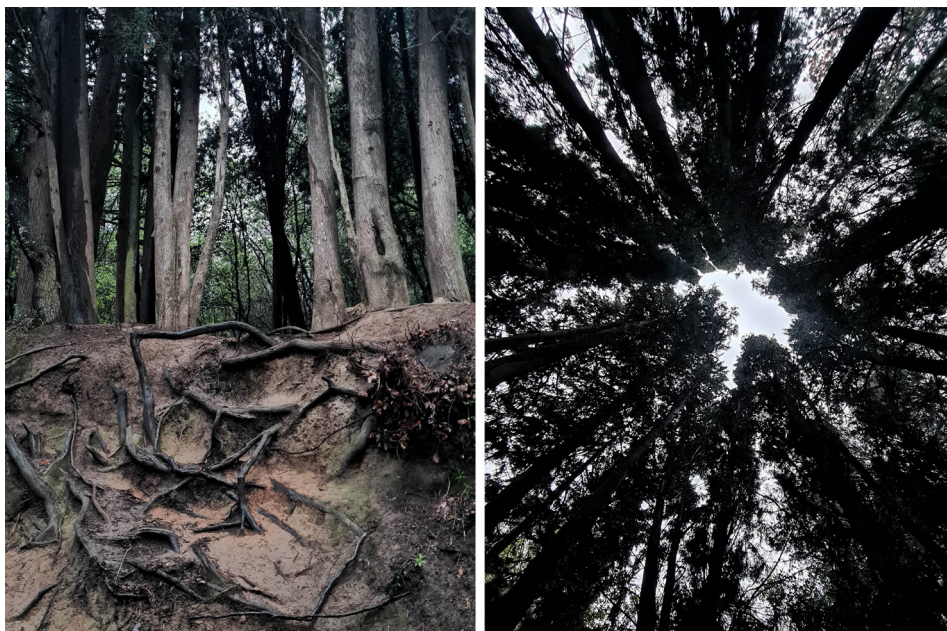
Figura 18. Cercle de les Bruixes, Centelles. (Acció 13)