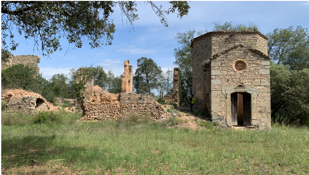
Figura 2. Centre d'Interpretació de la Bruixeria (Sant Feliu Sasserra) (a. 3)