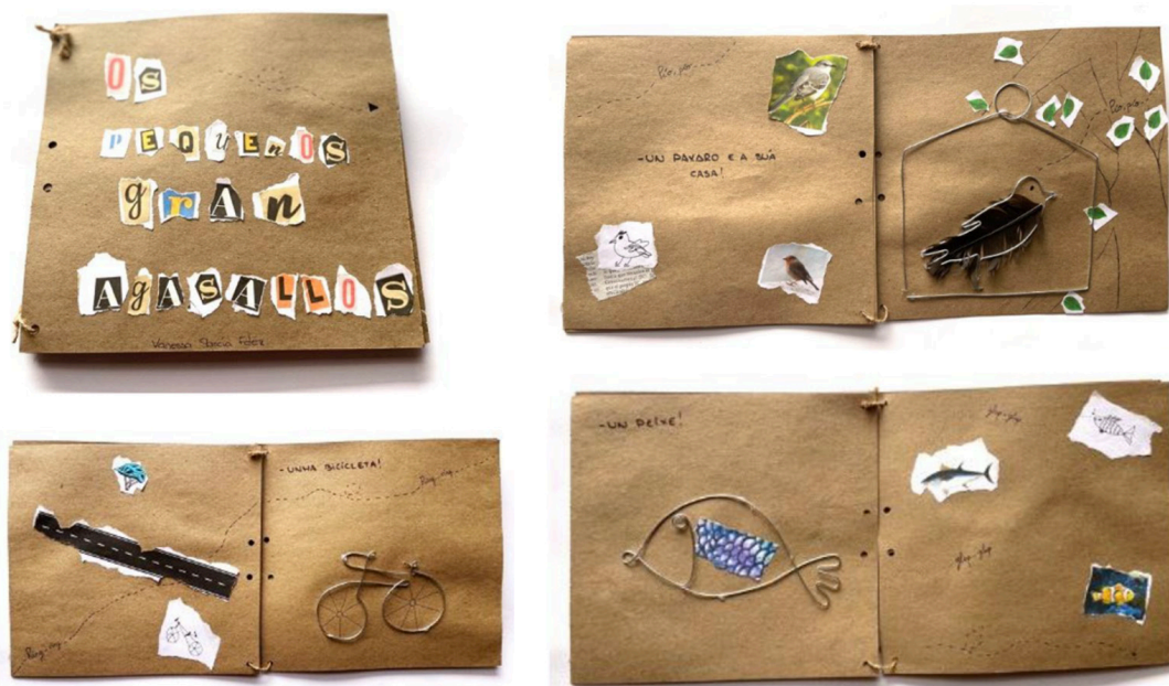
Figura 12 . Montaje imágenes cuento ilustrado Os pequenos gran agasallos . Curso 23-24.Universidade de Vigo.

El cuento Os pequenos gran agasallos nos muestra el uso de material reciclado, especialmente el cartón y la técnica del collage, que no sólo enriquece visualmente la obra, sino que también transmite un mensaje de conciencia ecológica. Esta elección demostró sensibilidad hacia el entorno y una mirada pedagógica que valora los recursos accesibles, promoviendo la reutilización y el arte sostenible. En otra línea encontramos alumnado que indagó e investigó, en este caso desde lo digital, abordando y cuestionando temas complejos como la libertad o la democracia (véase figura 13).