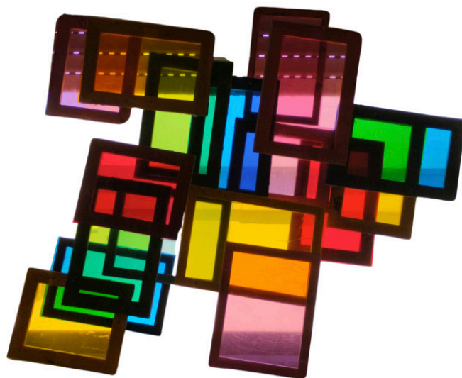
Figura 8. Montaje desde imágenes, cuento ilustrado El problema de Oni y de instalación artística realizada por los autores. Universidad de Zaragoza. Curso 24-25.