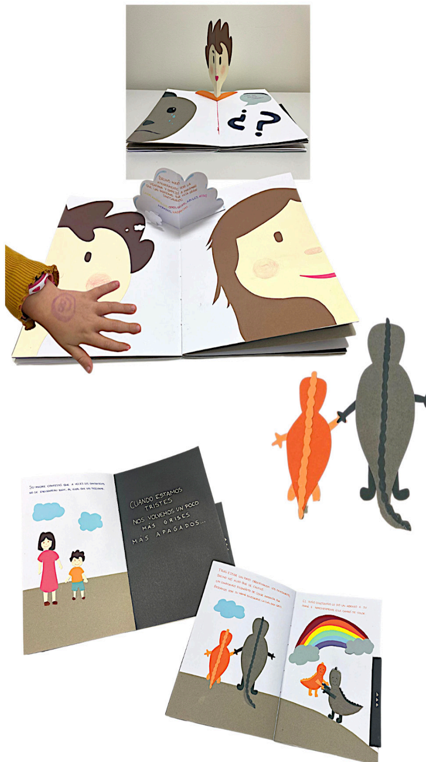
Figura 7. Montaje desde imágenes, cuento ilustrado Los colores de los abrazos . Universidad de Zaragoza. Curso 24-25.