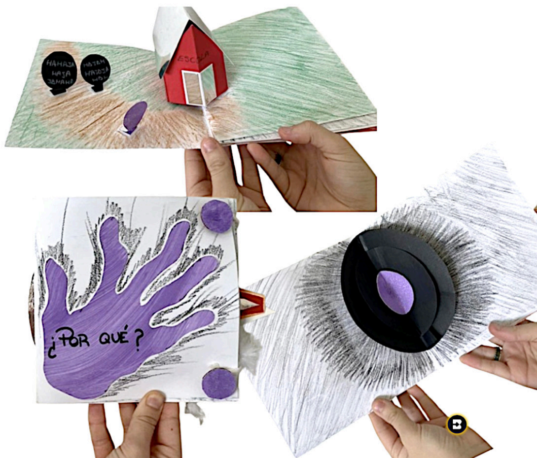
Figura 6. Montaje imágenes cuento ilustrado Curso 24-25. Universidade de Santiago de Compostela.