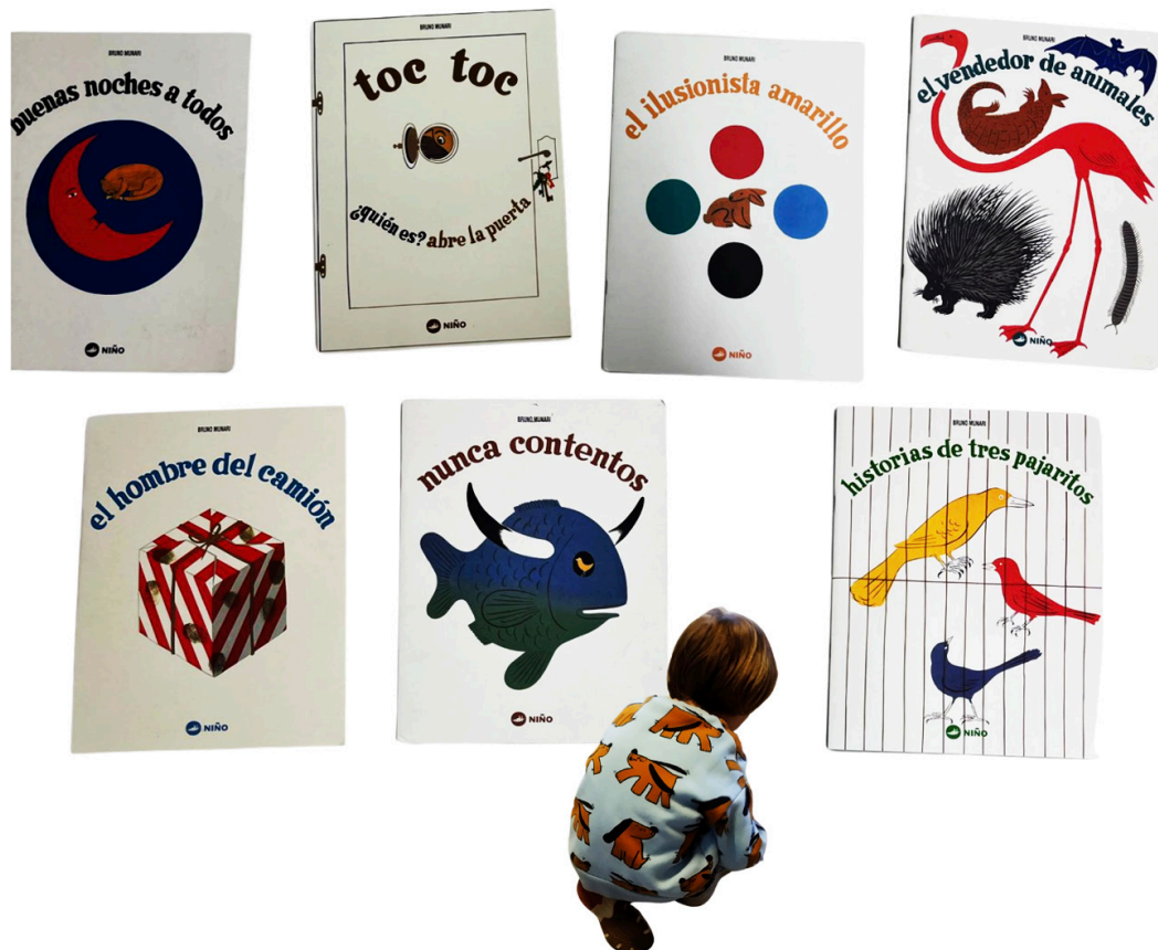
Figura 1. Montaje fotográfico. Muestra de cuentos ilustrados de Bruno Munari como parte del proceso.