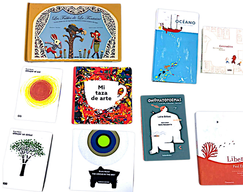
Figura 2. Muestra de cuentos ilustrados como parte del proceso.

Posteriormente, dicha propuesta debía ser contextualizada dentro de las etapas de Educación Infantil o Primaria, con especial énfasis en mantener el enfoque didáctico como objetivo fundamental a lo largo de todo el proceso. Para facilitar esta tarea, en las sesiones previas se ofrecieron al alumnado diversos ejemplos de álbumes ilustrados que abordaban temáticas variadas, con el fin de proporcionar un conocimiento amplio y enriquecedor sobre este tipo de producciones (véanse figuras 1 y 2).