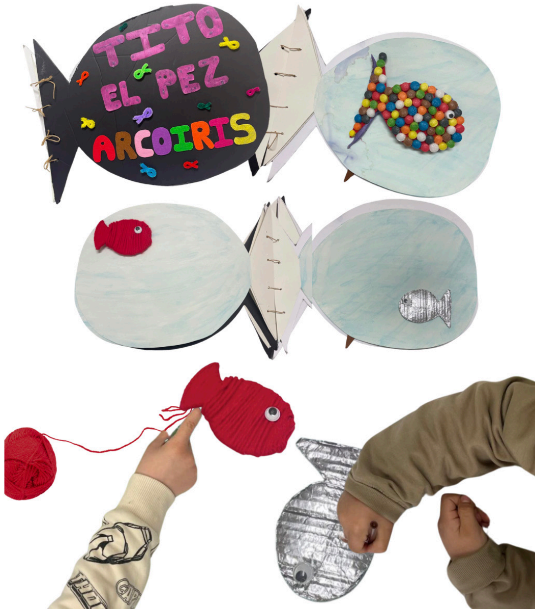
Figura 9. Montaje desde imágenes, cuento ilustrado Tito, el pez arcoíris , Universidad de Zaragoza. Curso 24-25.