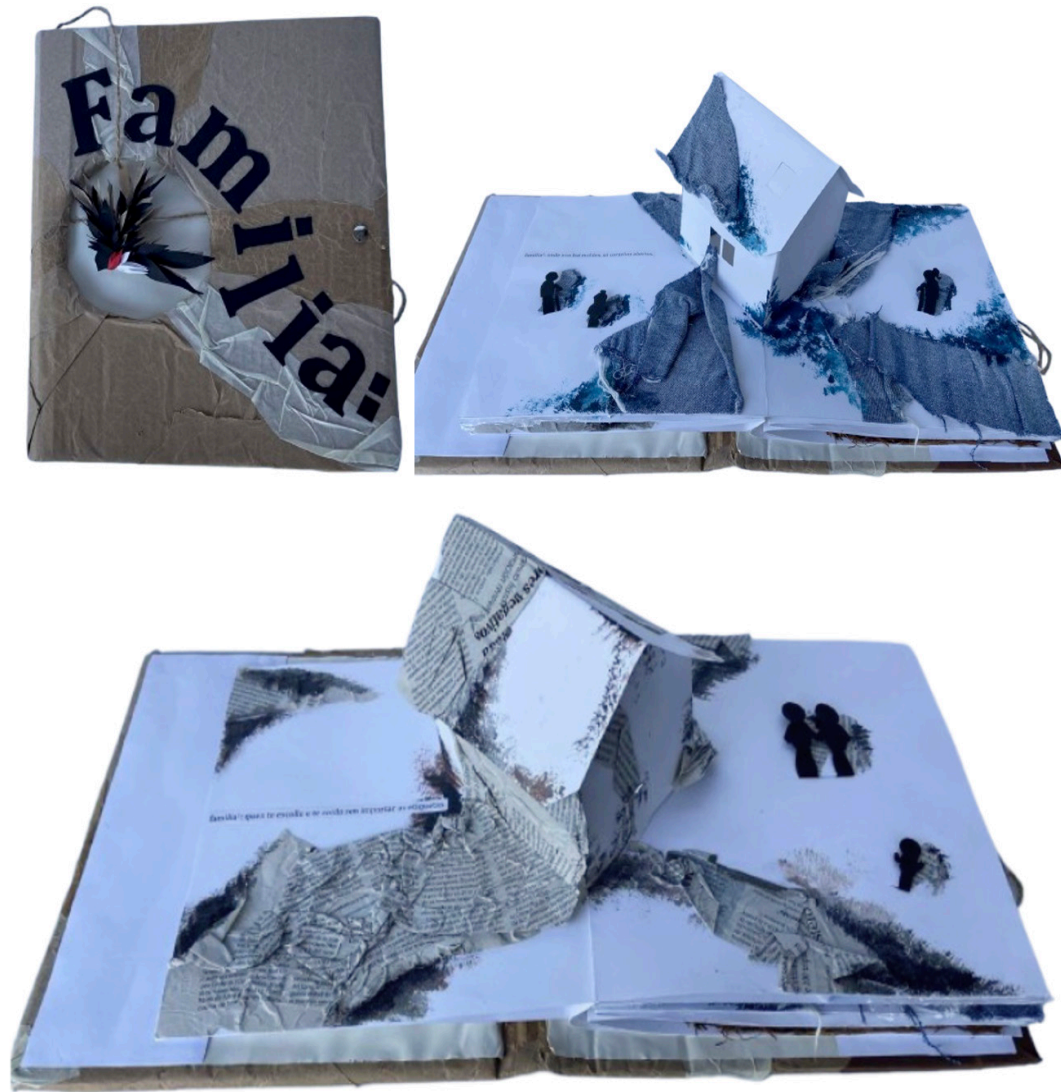
Figura 10. Montaje desde imágenes, cuento ilustrado Familia . Universidade de Santiago de Compostela. Curso 24-25.