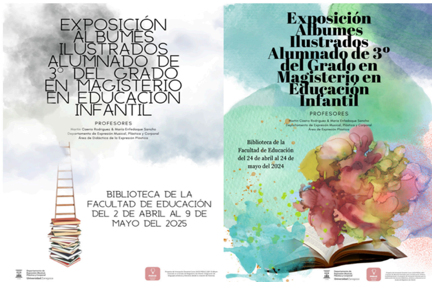
Figura 4. Carteles de las exposiciones de los cursos 23/24 y 24/25. Universidad de Zaragoza Biblioteca de la Facultad de Educación.