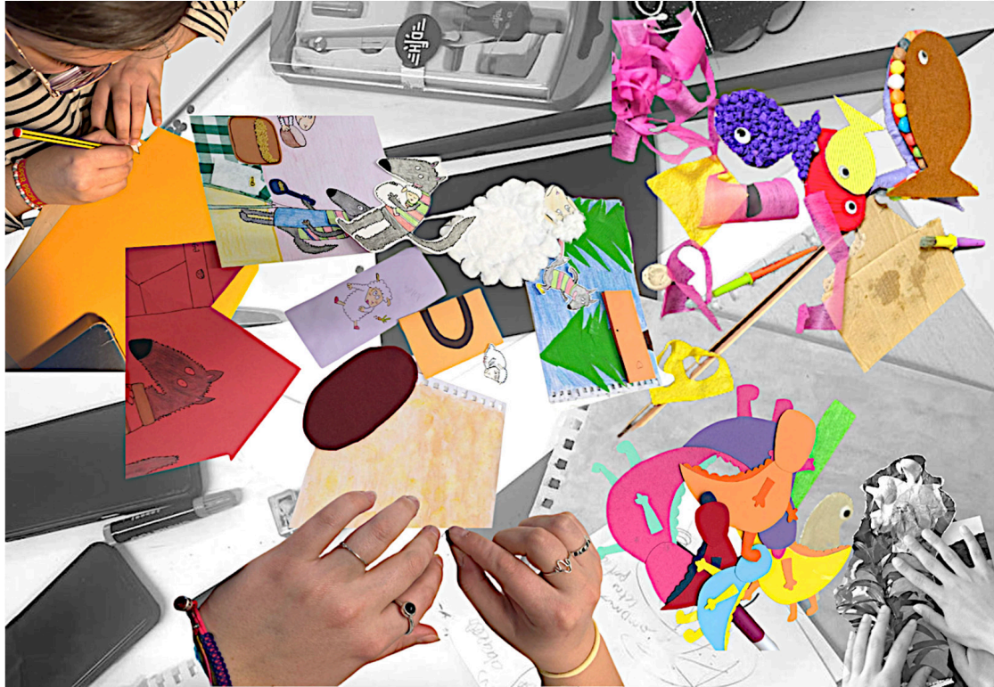
Figura 3. Montaje y collage fotográfico. Procesos.

Como cierre del proyecto, se organizó una exposición con los cuentos ilustrados elaborados por el alumnado, la cual tuvo lugar en los distintos campus (véase figura 4 y 5). Esta exposición desempeñó un papel significativo en el proceso de aprendizaje, ya que permitió a los estudiantes ver su trabajo reconocido y visibilizado en un entorno académico. Dicha experiencia contribuyó a fortalecer el sentido de logro y pertenencia, a la vez que mitigó inseguridades frecuentes respecto a las artes visuales y plásticas, especialmente en aquellos estudiantes que no se identifican como “artísticos”. Además, la muestra permitió evidenciar la aplicabilidad de los contenidos de la asignatura en contextos reales, facilitando la comprensión de la relación entre lo didáctico y lo artístico. En este sentido, se hizo visible cómo es posible enseñar a través del arte, integrando la expresión plástica y visual como recurso pedagógico en la educación infantil y primaria.