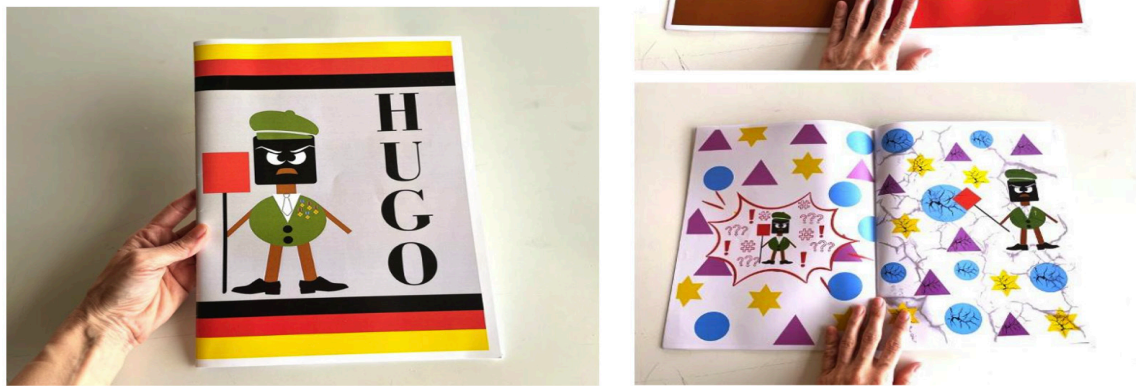
Figura 13. Montaje imágenes cuento ilustrado Hugo . Curso 23-24.Universidade de Vigo.

Alejándose de lo tradicional el alumnado construyó libros-objetos desplegables, como el que podemos observar (véase figura 14) compuesto por varias capas de cajas que se abren hacia fuera como una flor o mandala. Este diseño interactivo y lúdico invita al lector a explorar el contenido con las manos, despertando la curiosidad y la sorpresa, lo cual es esencial para el aprendizaje emocional en edades tempranas. A diferencia de un cuento con texto, este libro propone una narrativa interactiva y abierta, convirtiendo al niño o la niña en el protagonista que construye su propio recorrido, lo cual es coherente con enfoques didácticos centrados en el desarrollo de la autonomía y el autoconocimiento.