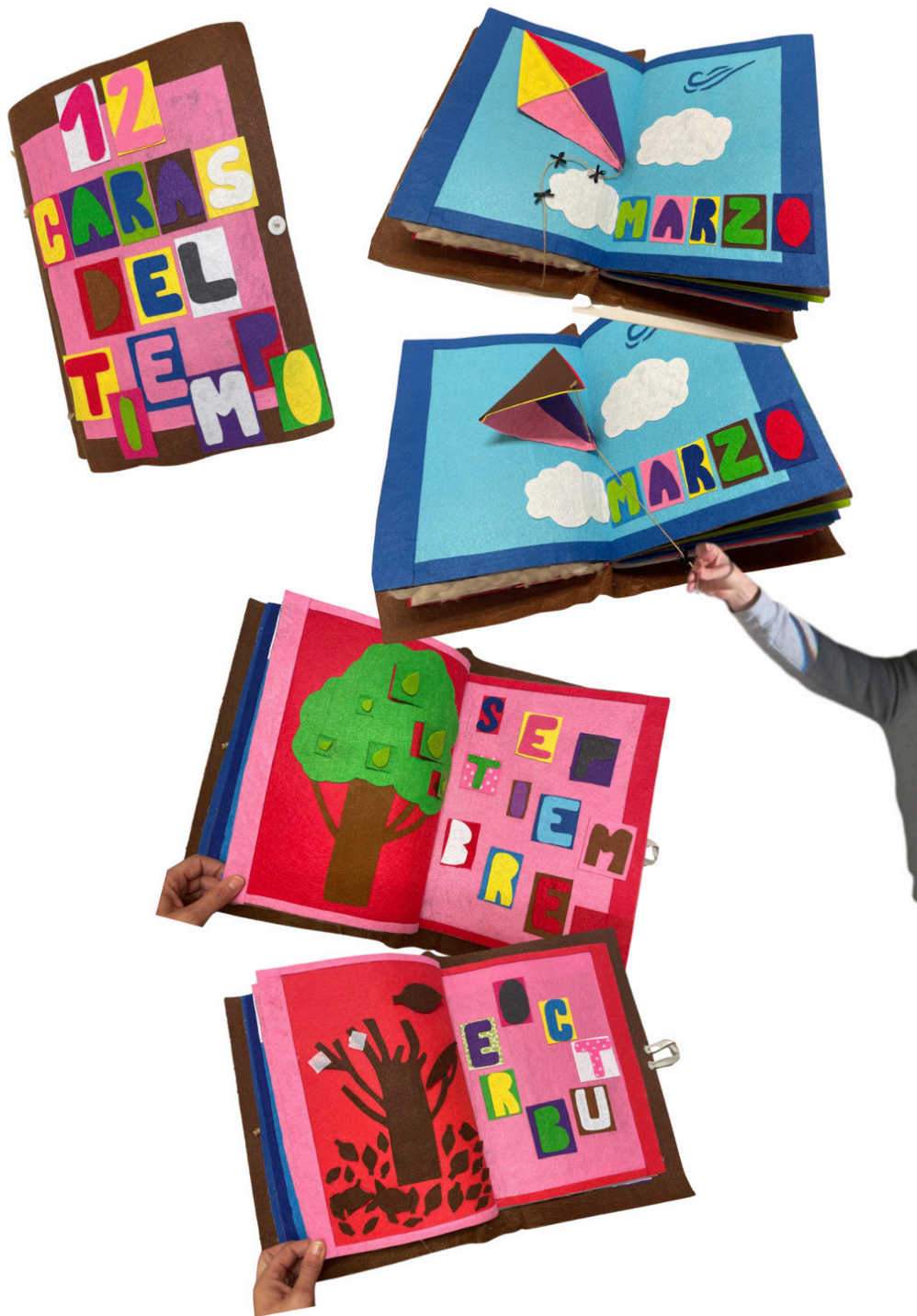
Figura 11 . Montaje desde imágenes cuento ilustrado 12 caras del tiempo . Universidad de Zaragoza. Curso 24-25.