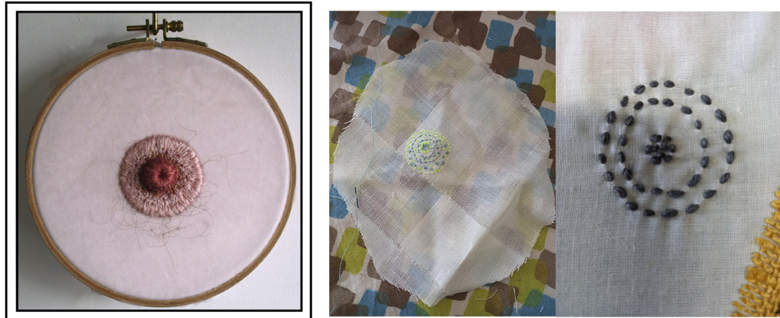
Figura 1. Begoña Yáñez-Martínez (2024) Taller Textil Tetil I . FOTENSAYO, compuesto por una CITA VISUAL LITERAL, Sally Hewett (2010) Penélope y PAR VISUAL compuesto por Inés Montes (2023) Sin título y Sata (Lidia) García Molinero (2023) Estoy hasta las tetas (detalle) FOTOGRAFÍAS de Lorena López-Méndez (2023).