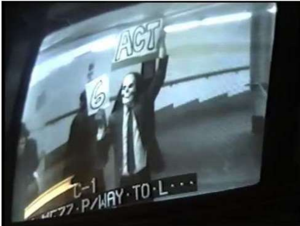
Fig. 1. Surveillance Camera Player durante la acción realizada delante de las cámaras de videovigilancia. Imagen extraída de la web: www.factoryschool.com .

está cometiendo en la actual sociedad en lo que se refiere a la instalación de dispositivos de videovigilancia, precisamente con la abundancia de estos dispositivos tanto en el espacio público como en el espacio privado.