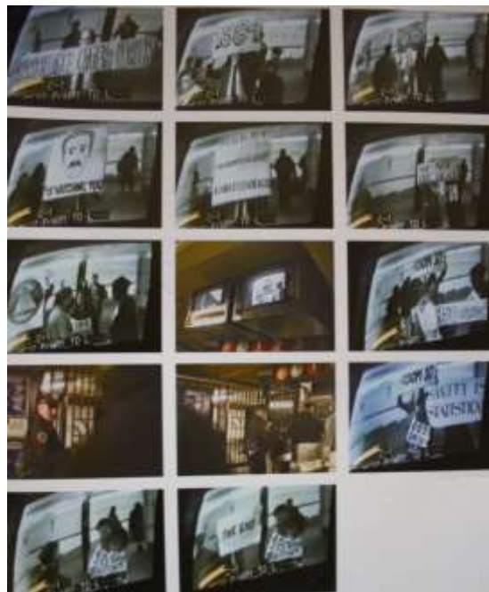
Fig. 5. George Orwell's 1984 , Performance Surveillance Camera Players, 1999. Imagen extraída de: CTRL [SPACE] Rhetorics of Surveillance from Bentham to Big Brother , Surveillance Camera Players, George Orwell's 1984, p. 617.

mencionado unos 8 o 9 minutos aproximadamente de actuación, los dos camarógrafos grabaron la actuación por dos lados, uno justo el lugar donde se producía la performance al paso de la gente por ese espacio, y otra grabación justo delante de los monitores de los circuitos de CCTV donde se vio reflejada la actuación de los SCP13. El resultado final, una dramatización de la novela “1984” de George Orwell frente a los circuitos cerrados de televisión (CCTV) en una videoinstalación de una duración final de 9’:42” (VV.AA. 2007, p. 157) más la documentación resultante de la acción, en la que se puede observar a través del alzado de carteles escritos con diferentes simbologías y palabras como reivindican la privacidad e intimidad de las personas que son expuestas a las cámaras de vigilancia en el espacio público. Este es un claro ejemplo de videoperformers de los tantos que realizan el colectivo activista frente a las cámaras de videovigilancia de la ciudad de Nueva York en los últimos años. A continuación mostraremos un extracto original del guión de 1984 de Surveillance Camera Players.