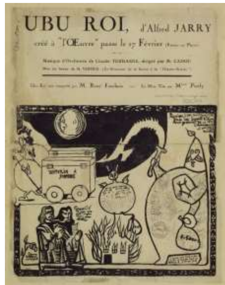
Fig. 3. Ubu Roi , Alfred Jarry, 1896.

La primera representación que comenzaron realizando los SCP fue " Ubu Roi " Ubu Rey