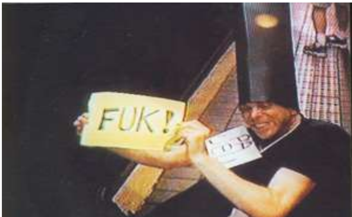
Fig. 4. Extracto de la performance realizada por los SCP ante las cámaras de seguridad sobre la adaptación de Ubú Rei de Alfred Jarry. 1996. Imagen extraída de la web: www.notbored.org .