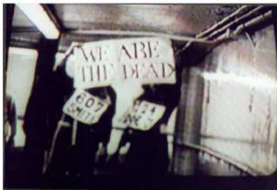
Fig. 2. Surveillance Camera Player, acción frente a los dispositivos de CCTV.

Pero para un grupo de artistas-refiriéndose a los artistas de Surveillance Camera Players-la cámara de vigilancia es un pilar importante. Los actores dependen de las cámaras de vigilancia para captar y transmitir sus actuaciones en la calle” (CNN U.S. NEWS, 2000). El colectivo de artistas necesitan las cámaras espías para poder llevar a cabo sus performances, es la herramienta principal en sus intervenciones. El público en sus inicios era un tanto peculiar, formado por el personal de seguridad, policía, comerciantes, etc. Que de un modo u otro se sentían obligados a visualizar estas representaciones activistas a través del monitoreo de los sistemas de seguridad. Pero en la actualidad ha cambiado, ellos consideran que cualquier persona que circula por la vía pública puede ser espectador de sus trabajos.