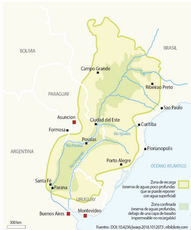
Mapa 1. Mapa del acuífero