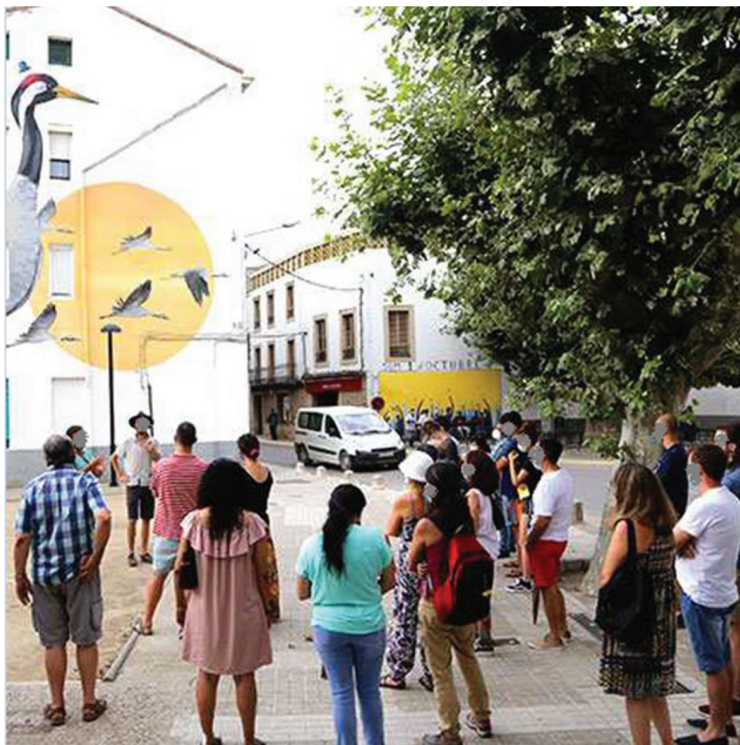
Figura 8. Visitantes contemplando el mural de la grulla común, año 2023