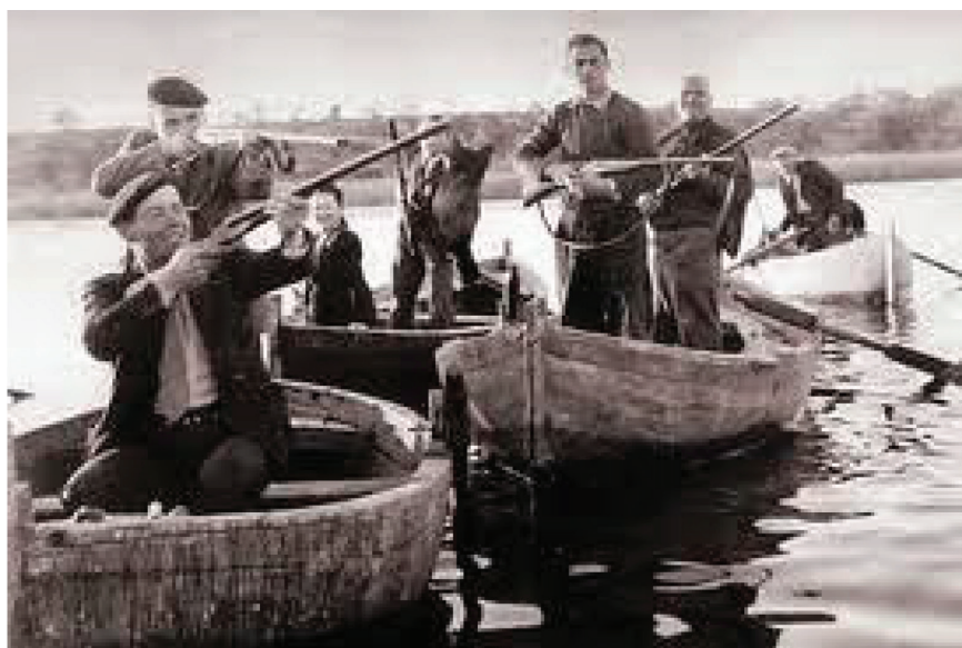
Figura 3. Cazadores en el estanque, año 1940