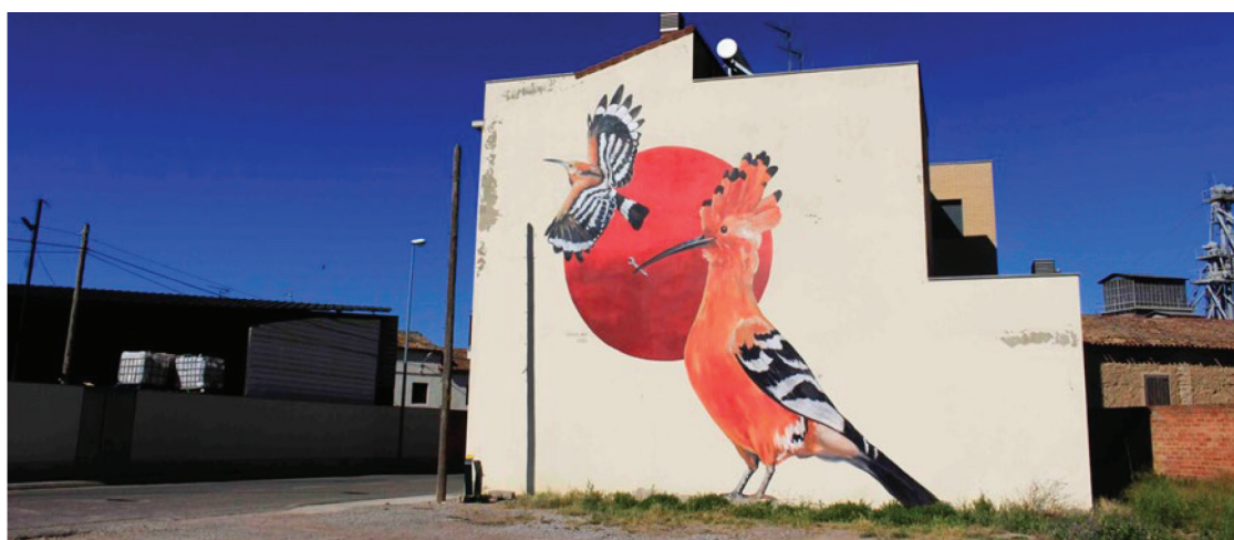
Figura 6. Abubilla, año 2023

En latín, Athene noctua , común en la zona y se trata del más diurno de los búhos de la zona. Sus dimensiones aproximadas son de 23 centímetros de largo y 55 centímetros de ancho, en pleno vuelo. Es común y se puede observar fácilmente. Se alimenta de pequeños roedores, grillos, escarabajos y gusanos. Se recoge en cabañas abandonadas y se puede observar en pilas de piedras. En la Figura 8 se muestra visitantes contemplando el mural de la grulla común.