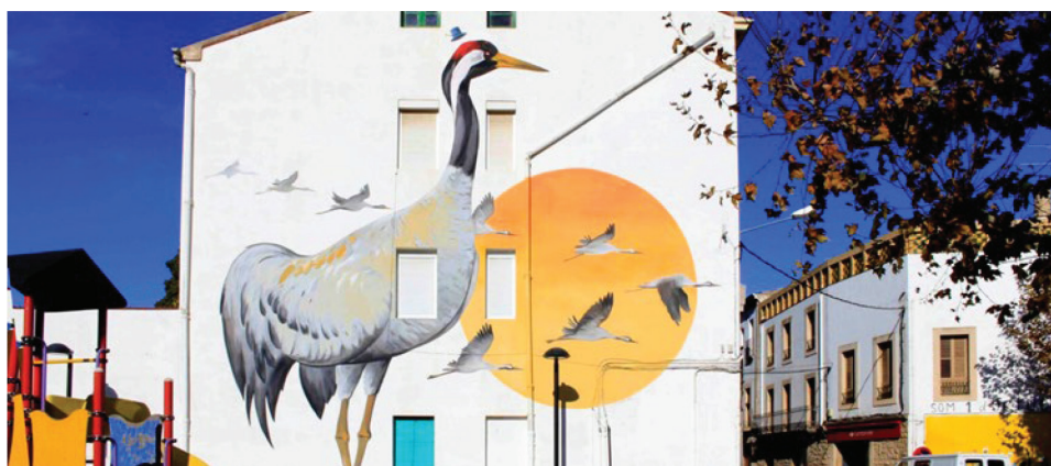
Figura 5. Grulla común, año 2023

L'Enciclopèdia Mural (La Encyclopedia Mural) es un proyecto liderado por el artista local Swen Schmitz Coll 25 , pretende representar las aves más significativas de la zona en las paredes y muros de los pueblos cercanos (Ivars d'Urgell, Vallverd y Vallbona de les Monges). El proyecto quiere embellecer los pueblos con dibujos ornitológicos para consolidar un vínculo entre la naturaleza y las personas. La Enciclopedia Mural son dibujos de gran formato representativos del entorno natural cercano. Están en espacios públicos: paredes, muros...; son accesibles y pueden ser vistos por todos los visitantes. En total se encuentran 54 murales: 44 en Ivars d'Urgell, 8 en Vallverd, 1 Vallbona de les Monges y 1 en el estanque. El proyecto tiene una perspectiva artística, educativa y medioambiental del entorno rural. Algunos de los murales más representativos en Ivars d'Urgell, Figura 5.