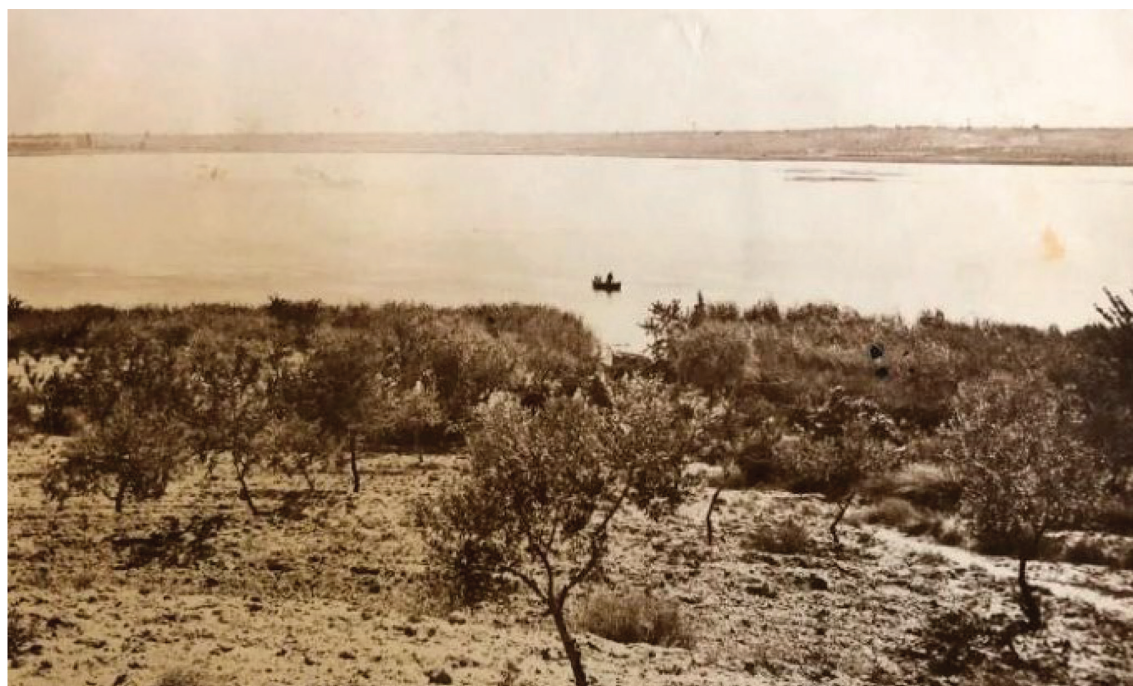
Figura 4. Foto panorámica del estanque antes de la desecación, año 1948