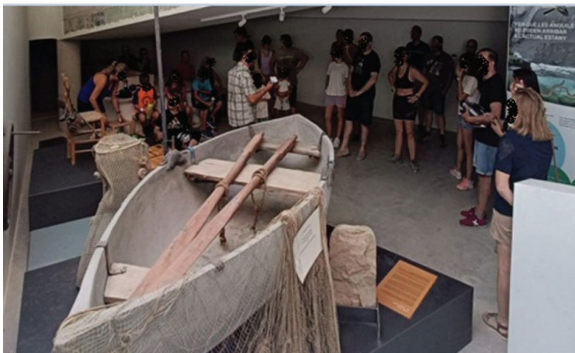
Figura 9. Casa-museo Cal Sinén, año 2023