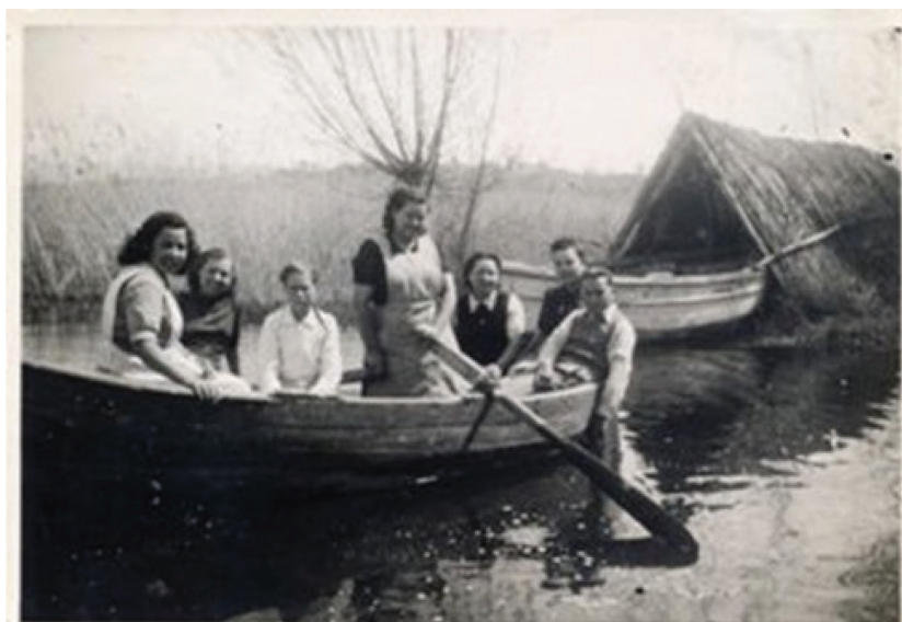
Figura 2. Paseo en barca por l'Estany d'Ivars, año 1940

El estanque era lugar de tránsito migratorio de aves, de zonas más frías (del norte de Europa) hacia el sur (más templado). Cazaban patos ( anas platyrhynchos ), perdices (perdix perdix) y focha común ( fulica atra ) y pescaban principalmente anguilas ( anguilla anguilla ) en grandes cantidades. Una informante explica, "había muchos cazadores que venían de lejos, de ciudades como Barcelona, Lleida, Tarragona..., solamente para cazar. Venía gente muy conocida... políticos, empresarios...". Después de cazar tenían el almuerzo, como un acto social para hablar de forma distendida y entretenerse. Hubo algunos accidentes cazando, "en algún caso hubo accidentes, algún disparo accidental de la escopeta; una vez un cazador perdió una pierna... Hubo más accidentes, aunque no recuerda ninguna muerte, solamente algunos heridos". En la zona había hostales y casas para comer y pernoctar; cerca del estanque recuerdan