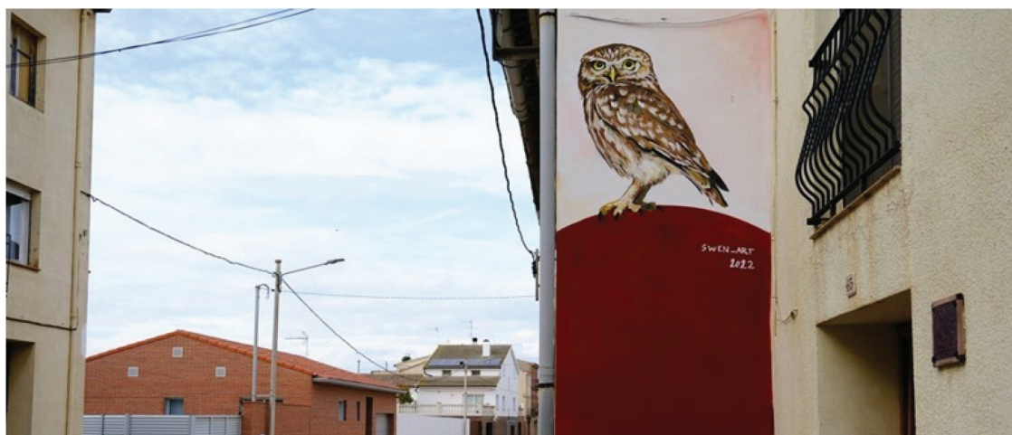
Figura 7. Mochuelo europeo, año 2023