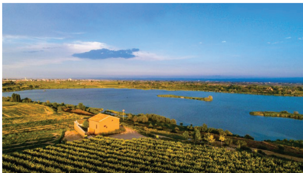
Figura 1. Panorámica de l'Estany d'Ivars, año 2022

L'Estany d'Ivars, Figura 1, está situado entre las localidades d'Ivars d'Urgell y Vilasana (antigua Utxafava), en la comarca del Pla d'Urgell 23 . Tiene una superficie total de 126 ha. (con l'Estany de Banyoles, en Girona, son los mayores en superficie de Cataluña), 2,4 hm 3 de agua, 3,8 metros de profundidad máxima, 2.150 metros de longitud por 730 metros de anchura máxima y 5.400 metros de perímetro. El Canal d'Urgell alimenta el estanque y este proporciona agua al río Corb.