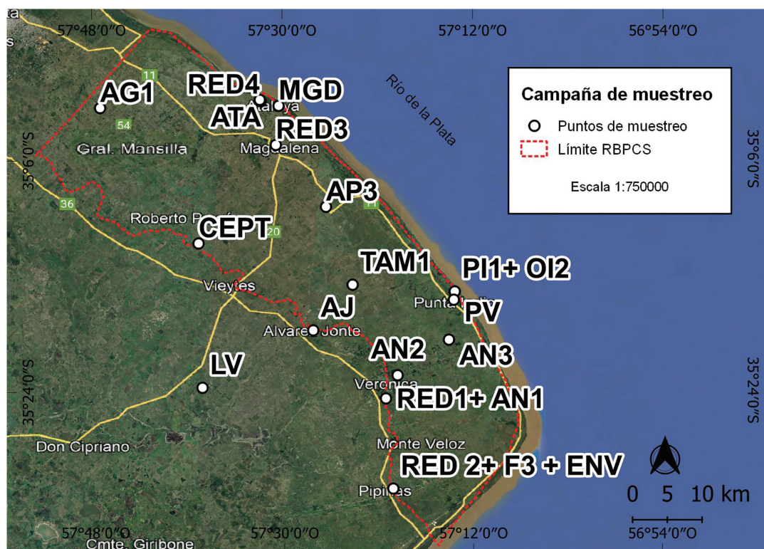
Figura 3. Ubicación de los sitios de recolección de muestras de agua