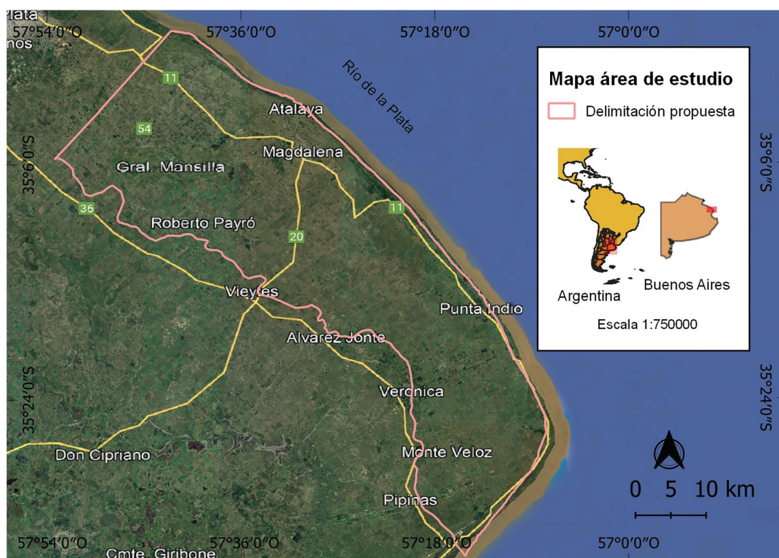
Figura 1. Delimitación del área de estudio. Reserva de Biosfera Parque Costero del Sur.