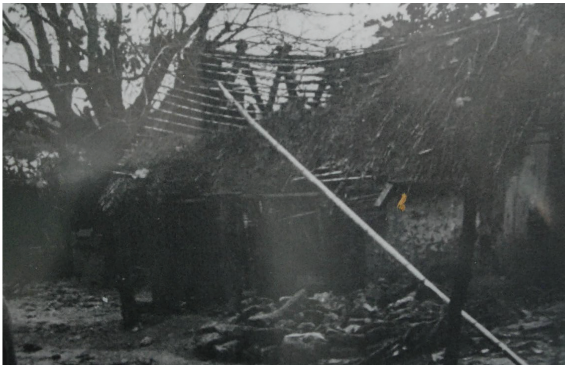
Figura 6. Construcciones precarias en el asentamiento de Monte Cañuelo hacia mediados del siglo XX