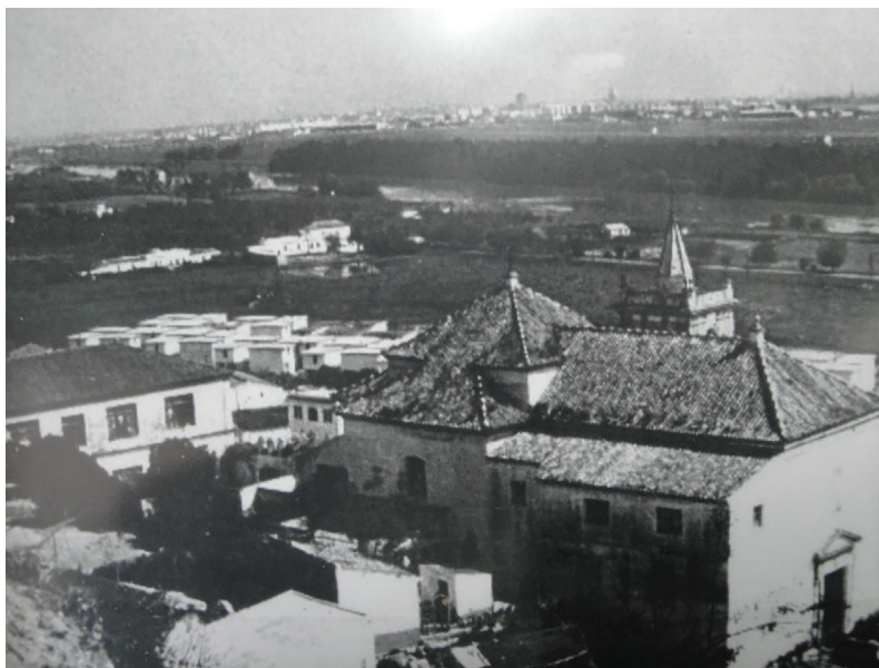
Figura 1. Vista del Valle del Guadalquivir desde Monte Cañuelo a mediados del siglo XX, con la parroquia de N a S a de Gracia en primer plano (Gelves, Sevilla)

El año 1960 empezó en Sevilla con previsiones de ser también un año lluvioso como lo había sido el año anterior. El diario vespertino de la capital del 8 de enero ya anunciaba, recogiendo el pronóstico de un popular zahorí palentino, que febrero venía “con el signo de la