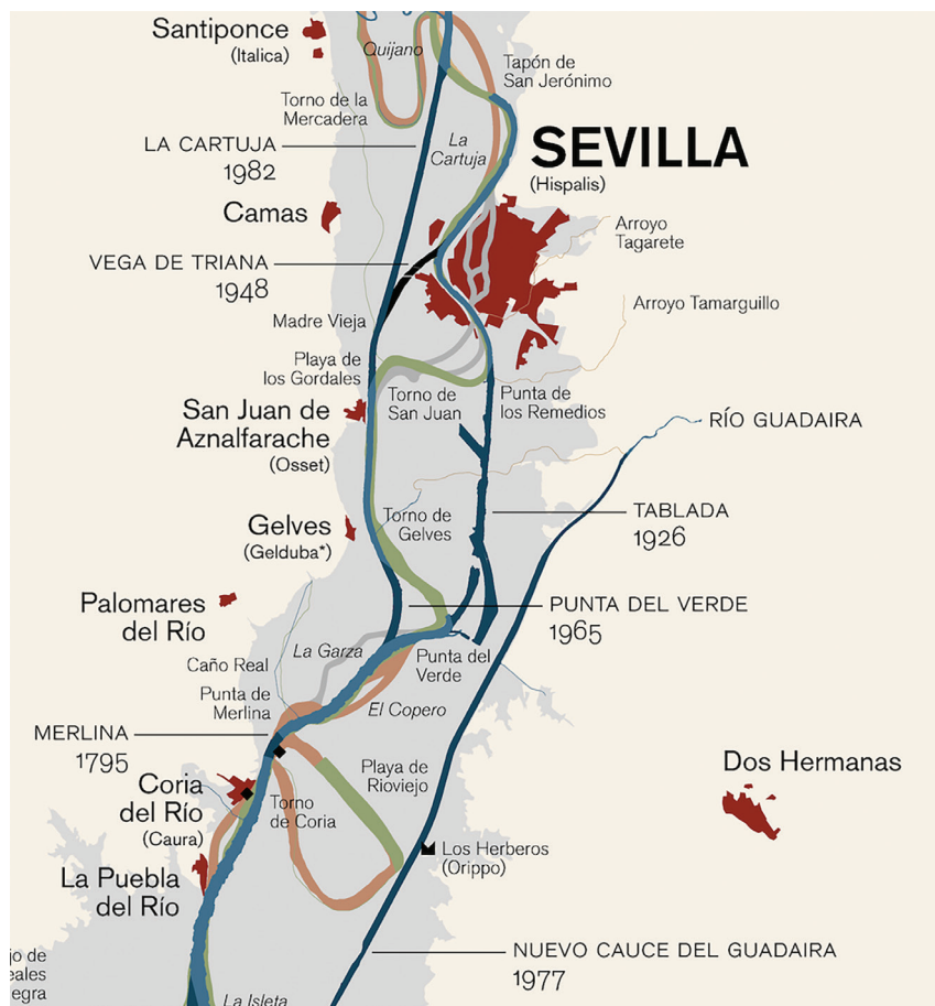
Figura 2. Tramo del río Guadalquivir en torno a la población de Gelves, con las modificaciones de los cauces fluviales del río mencionado y del Guadaíra