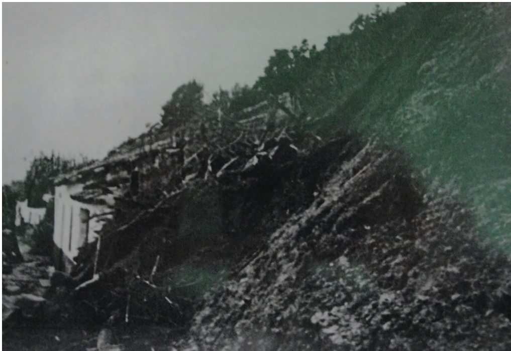
Figura 4. Efecto de los corrimientos de talud de la Cornisa del Aljarafe en las viviendas de Monte Cañuelo hacia mediados del siglo XX

Al igual que ocurría en las zonas bajas del Valle del Guadalquivir de la propia localidad de Gelves, la población con menos recursos construía sus viviendas en zonas de alto riesgo, tanto de inundación como de deslizamientos de la cornisa, en las que otras clases sociales mejor posicionadas no lo hacían. Ya hacía alusión a ello un artículo de Celestino Fernández Ortiz en el periódico