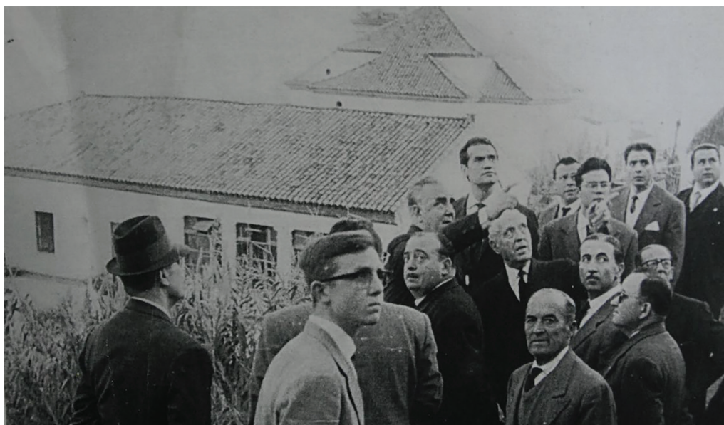
Figura 5. Autoridades observan Monte Cañuelo tras la desgracia de 1960

este incidente con otros. Los mecanismos atmosféricos que funcionan en estas latitudes y los fenómenos meso escalares que afectan sistemáticamente al suroeste peninsular, así como la situación peculiar de 1960 pudieron influir en el origen del deslizamiento del talud que afectó de lleno al asentamiento de chozas de Monte Cañuelo, el cual se produce en un ciclo lluvioso que fue especialmente activo entre 1958 y 1966 como nos confirman los datos de los niveles de crecida del río y que nos permiten enriquecer el contexto climático e hidro-geomorfológico que redundaron en una mejora de las condiciones de la población que allí residía 19 . Estas condiciones climáticas y geomorfológicas, combinadas con el asentamiento humano en un lugar de alto riesgo, baja calidad constructiva y una propiedad del suelo edificable en manos del duque de Alba desencadenó toda una serie de hundimientos en cadena de chozas que alcanzaron su momento más trágico con la muerte de los hermanos Carmona el 14 de febrero de 1960. Solo a partir de esta fecha las continuas llamadas del alcalde de Gelves a actuar contra las propiedades del duque mediante la expropiación de suelo tuvieron repercusiones a nivel de toma de decisiones políticas (Figura 5).