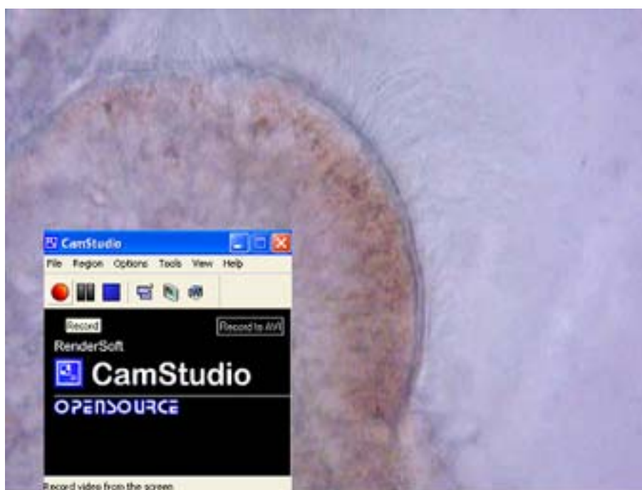
Fig. 4. Captura de pantalla del momento en que se graba una secuencia de video directamente del microscopio, mediante la aplicación CamStudio .