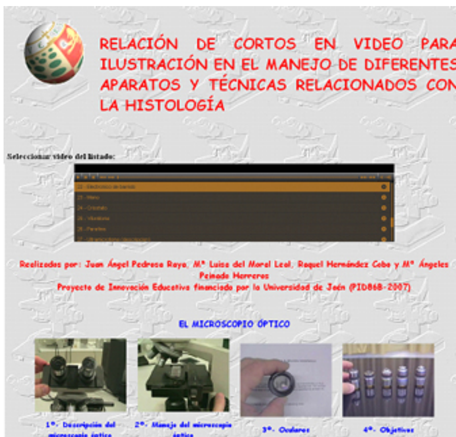
Fig. 1. Aspecto de la página web donde se insertan los videos elaborados.

Estas consideraciones son las que movieron en su día al grupo de profesores autores de este trabajo a diseñar el aludido Proyecto, cuyos resultados, gracias a la colaboración del Vicerrectorado de Tecnologías de la Información y Comunicación de la Universidad de Jaén, se encuentran actualmente disponibles en la dirección: http://virtual.ujaen.es/histologia , ( Fig. 1 ) y están ya siendo utilizados como recurso en línea por los estudiantes. Igualmente, para el caso de los que no dispongan de conexión a Internet, se ha solicitado también del Servicio de Publicaciones de la Universidad, su edición en formato DVD.