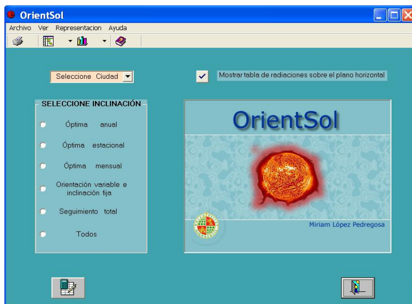
Figura 2. Entorno de OrientSol.

Por otro lado, como docentes nos gustaría destacar que se ha logrado una asimilación de las competencias prácticas más sencilla. En el tiempo en el que el programa se está usando se ha conseguido mejorar el conocimiento de esta parte de la asignatura por parte de los alumnos, y los resultados conseguidos por ellos han mejorado.