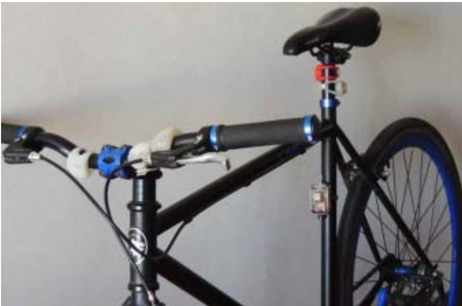
Figura 5, Bicicleta de nuestro informante con el RUBI utilizado en el estudio (versión que tenía el botón on/off)

“Un amigo un día ocupó Runstastic [app privada gratuita] para salir a trotar y lo compartió en Facebook [...] mis piques aquí en la bicicleta son quince minutos, veinte minutos, me daba lo mismo tener el control de eso, la ocupaba más como medio de transporte. Y un día cuando fue la primera vez que me