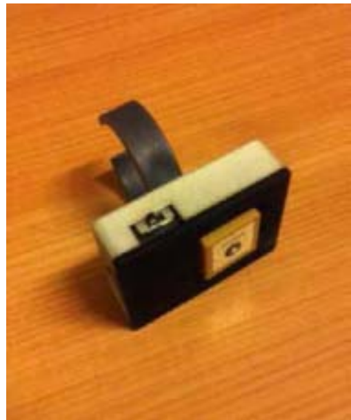
Figura 4. Primer prototipo del dispositivo RUBI (izquierda) y versión más reciente (derecha)