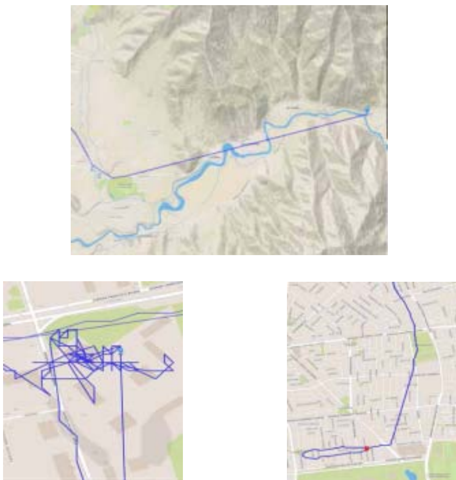
Figura 8. Ejemplos de recorridos afectados por el dispositivo y su GPS.

Sebatian nos narra un ejemplo de este tipo de situaciones que le ocurre a menudo. Desde su computadora nos muestra con extrañeza el caso de dos RUBIEs -graficados como dos puntos de color en el mapa- que partían juntos por una ciclovía y luego se separaban abruptamente. Ante este comportamiento, decidió ponerse en contacto con esos dos puntos-ciclistas que visualizaba en su pantalla, y que no respondían a ninguna lógica esperable desde el punto de vista de la racionalidad de nuestro ingeniero. El caso anómalo resultó provenir