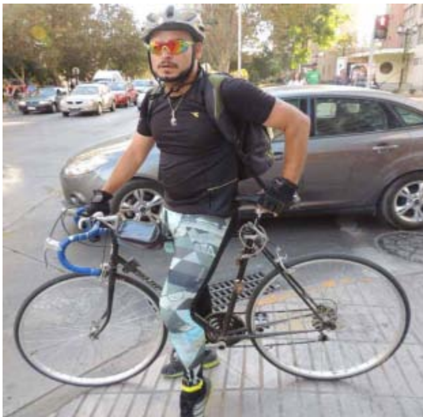
Figura 6. Ciclista y su bicicleta con el dispositivo RUBI anclado.