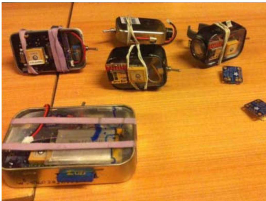
Figura 3. Prototipos iniciales del dispositivo RUBI hechos con cajas de dulces

diferencia entre un dispositivo diseñado para que usuario se ocupe de ocuparlo, versus el otro dispositivos que va orientado a la bicicleta” (Sebastian).