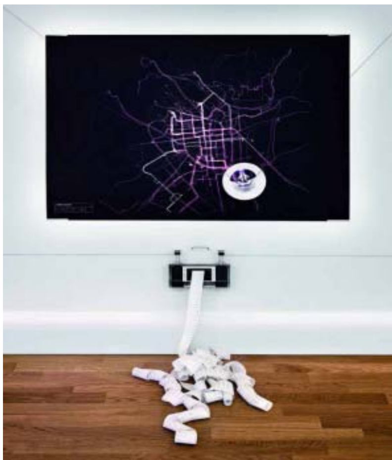
Imagen 1. Instalación de Scholz y Volkmer en el museo de Wiesbaden.

tecnologías son “domesticadas”, significadas e incorporadas en la vida cotidiana de las personas (Lupton, 2013a: 8).