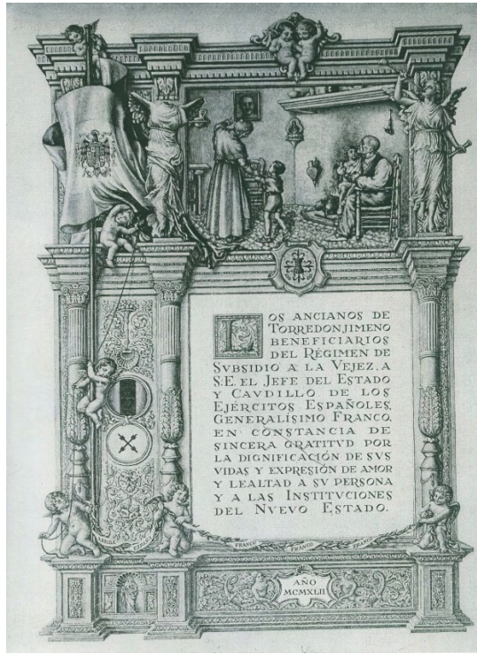
Imagen 3. Diploma que los ancianos de Torredonjimeno dedican a Franco (1943).

y un enfoscado tirolés. Ha sido preciso clavar diez grandes vigas de madera y otras dieciséis de menor diámetro. Llevará dispuestos el escudo de la ciudad y el de España y los emblemas del Movimiento, en los paños que cierran dos de los huecos laterales. En la fachada que da a la calle Bernabé Soriano figura la siguiente inscripción: “El Ayuntamiento de Jaén saluda al Caudillo”, y ambos lados la triple cartela de Franco, Franco, Franco”.