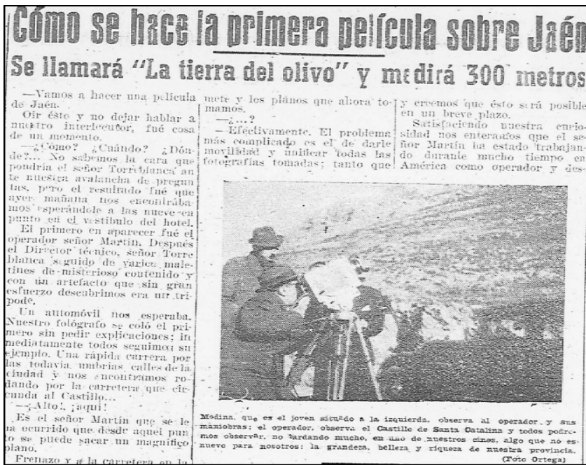
Imagen 1. Reportaje en el diario Jaén sobre el documental "La tierra del Olivo" (1943).

El rodaje tiene como objetivo capturar instantáneas sobre monumentos de la capital como el castillo y el templo catedralicio, las plazas de San Francisco y las Batallas, o las obras realizadas en el ensanche, todo bajo el hilo argumental del "ciclo de elaboración y producción de la aceituna". En el fondo fotográfico de la familia Ortega —custodiado en el Instituto de Estudios Giennenses— conserva seis fotografías del operador con la cámara y los reporteros giennenses. En ese momento, el de la captura de las imágenes por el operador de cine, es descrito de la siguiente manera en el periódico 6 .