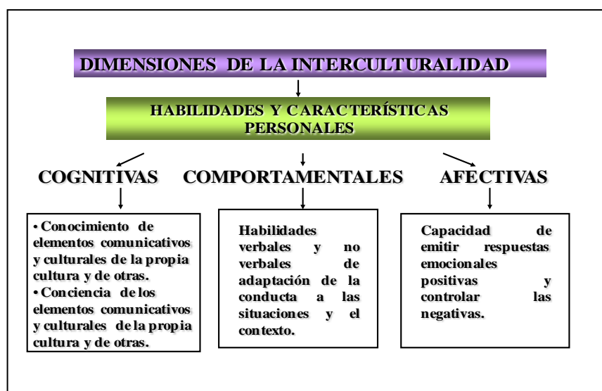
Figura 1. Modelo de dimensiones de la interculturalidad

Vilá (2003), hace algunos apuntes que inciden en la comunicación y las relaciones interculturales a partir del conjunto de habilidades cognitivas y afectivas para manifestar comportamientos apropiados y efectivos que favorezcan la comunicación intercultural. Desde variados matices, pueden considerarse tres dimensiones de naturaleza distinta: cognitiva, afectiva y comportamental.