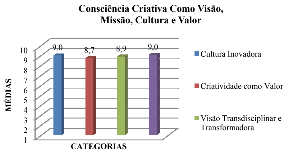
Figura 1. Nível de consciência criativa como visão, missão, cultura e valor.

- Consciência Criativa como Visão, Missão, Cultura e Valor - os indicadores do VADECRIE, agrupados neste primeiro gráfico são: 3º Cultura Inovadora, 4º Criatividade como Valor, 6º Visão Transdisciplinar e Transformadora, 10º Valores Humanos, Sociais, Ambientais.