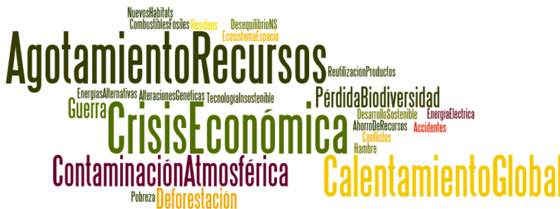
Figura 4: Nube de palabras sobre los temas de Educación Ambiental que aparecen en las C.E.F. en 3º E.S.O.

En este nivel se observa que los temas asociados al curriculum que más aparecen son los relacionados con el Agotamiento de recursos (8 citas) y con la Crisis y las cuestiones sociales de desarrollo sostenible y conflictos y desequilibrios sociales que suman 11 citas entre todas estas cuestiones lo que se refleja en la figura 4.