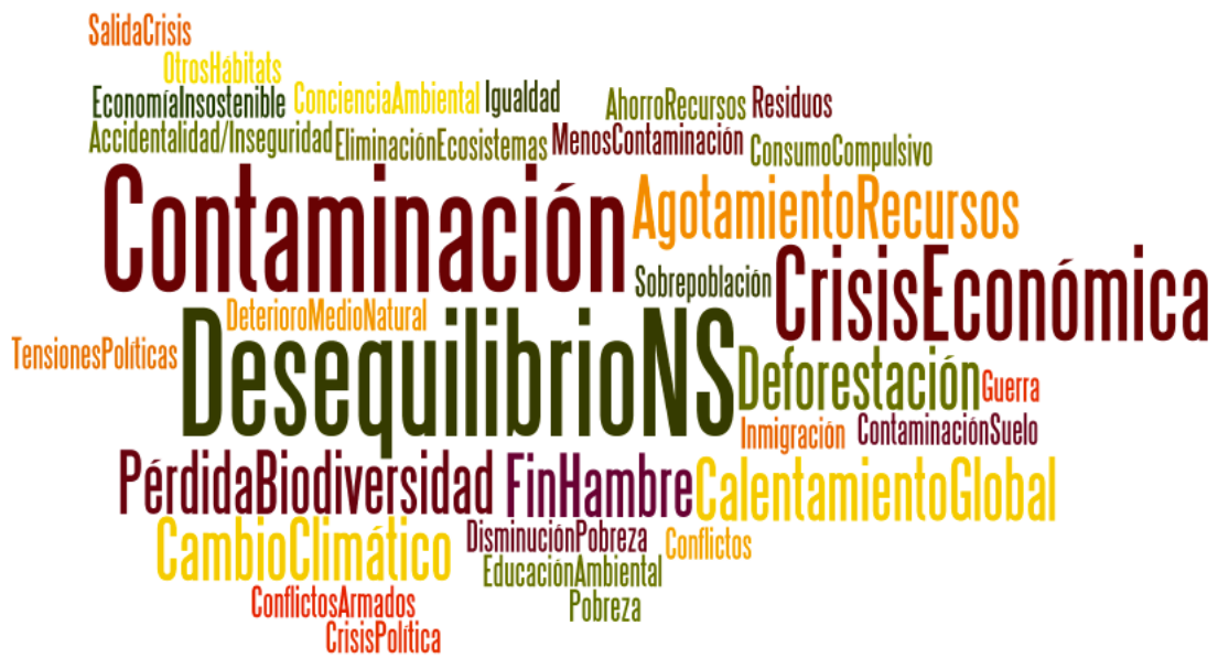
Figura 5: Nube de palabras sobre los temas de Educación Ambiental que aparecen en las C.E.F. en 4º E.S.O