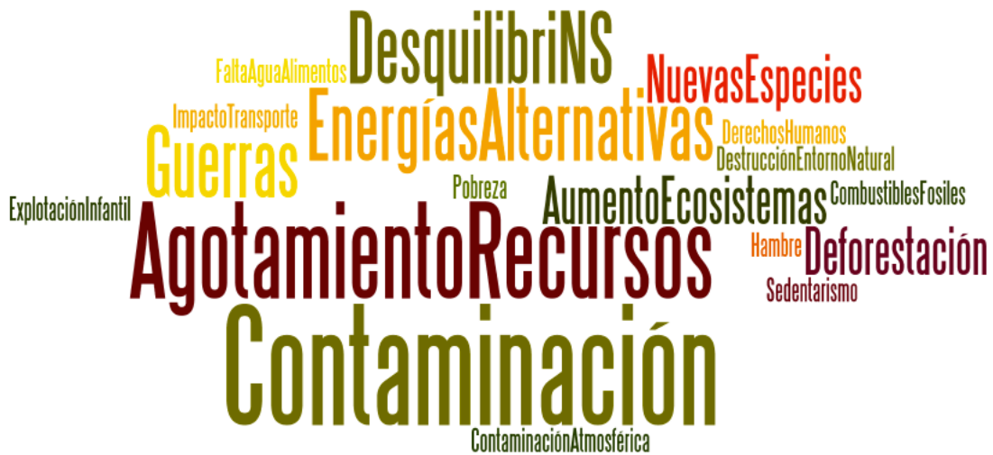
Figura 3: Nube de palabras sobre los temas de Educación Ambiental que aparecen en las C.E.F. en 2º E.S.O.

resultados de la tabla 2 muestran que los temas propios del currículum asociados directamente con el entorno natural, que más ha interiorizado el alumnado, son los relacionados con la Contaminación y Agotamiento de recursos (5 citas) y Agotamiento de recursos (4 citas). Destaca que en este grupo de 2º la problemática ambiental con fuerte impacto social (Crisis, Derechos Humanos, Guerras, etc..) son las que presentan un mayor número de citas como lo demuestra las menciones a la crisis global que estamos viviendo, con 8 citas de las 22 que forman el total de esa temática.