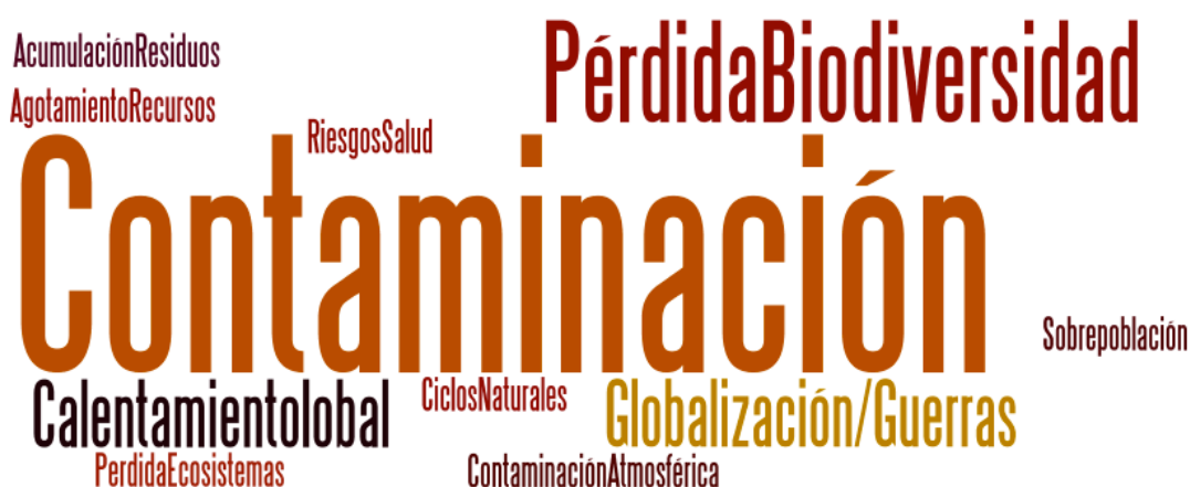
Figura 2: Nube de palabras sobre los temas de Educación Ambiental que aparecen en las C.E.F. en 1º E.S.O.

En un segundo plano la pérdida de biodiversidad presenta una relevancia notable, mientras que problemas globales como el calentamiento global o las guerras en consecuencia de la globalización estarían en el tercer lugar de importancia en cuanto a citas realizadas por el alumnado de 1º E.S.O. Por su parte, la contaminación atmosférica en concreto, los residuos, la sobrepoblación aparecen en pocas ocasiones junto a los riesgos de la salud y pérdidas de ecosistemas asociadas a las problemáticas anteriores.